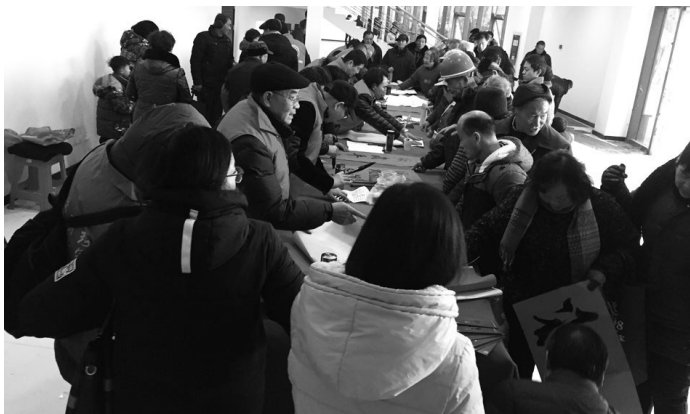
义务写春联现场围满了人。

与传统的庙会相比,此次“文化庙会”增加了非物质文化遗产动态和静态展示,让更多百姓能够更好、更直观地认识和理解。在当天的活动中,十多项非