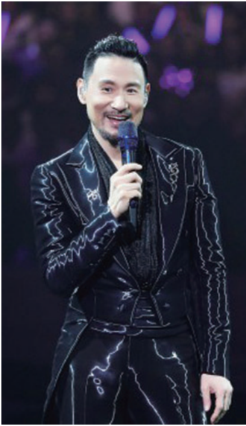
张学友在演唱会上。

张学友完成演唱会后接受访问,大会宣布张学友219场次演唱会已打破华人歌手的最多场次纪录,为香港争光。提及大女儿瑶华在观众席看得非常投入,经常和唱以及兴奋摆动,张学友自豪地笑着说:“她是我的歌迷,这次演唱会,她看过很多场了。(上台合唱?)不会!”至于“封麦克风”的传闻,他断然否认,他开玩笑说:“绝对没有这回事,不知道是不是主办单位放消息出来,令大家涌来购票。没人会知道明天的事,但我自己真的喜欢在台上表演,不太喜欢退休,自己在不同时间尝试和发挥不同的事。我刚开始都以为自己跳不到舞,没想到还是可以的,所以会继续做下去。”(颖颖)