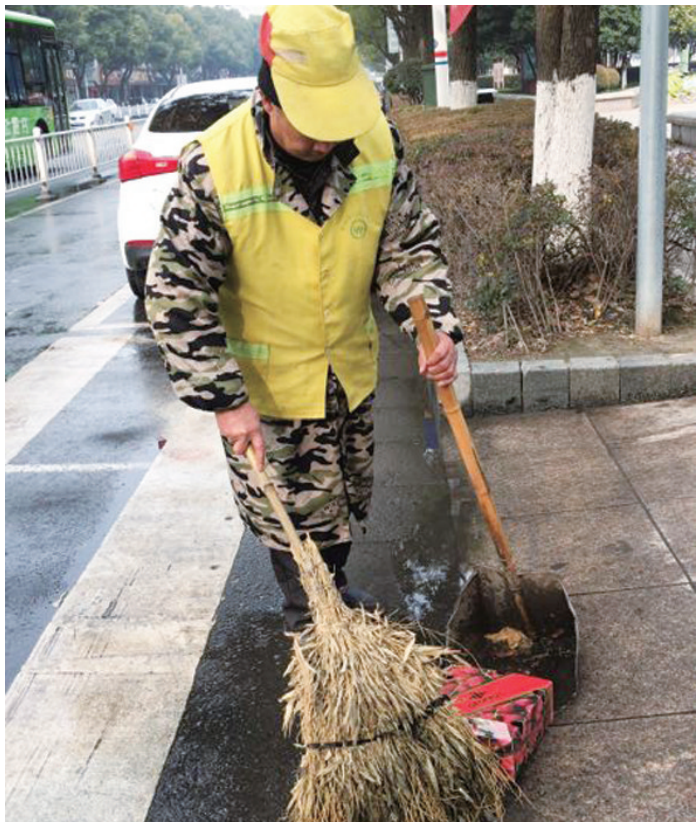
图为春节期间,环卫工人在清扫马路。

本报讯 (记者 王国禹 通讯员 徐志海)随处可见的烟花爆竹纸屑,空气中弥漫着刺鼻的味道……这些现象已留在了往年的记忆中。随着今年禁放令的实施,城市空气质量和环境卫生得到明显改善,这也不禁让门前三包所的环卫工人卜