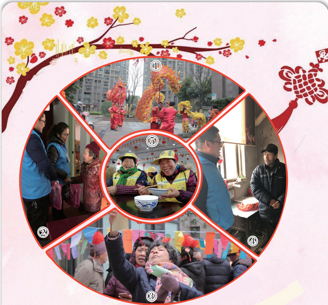
图①③：昨天，兴隆苑社区举行了猜灯谜活动，并联合水关路社区邀请专业人员在各个小区内开展舞龙舞狮、荡湖船、大头娃娃等民俗表演，让这个元宵节气氛更浓，活动吸引了很多居民观看和参与。此外，中山路和化肥路社区也举办了庆祝元宵佳节活动。

“尽管姚先生的做法是出于好心，但已经涉嫌违法，如果今后有市民再遇到这样的情况，需要立刻与当地警方联系，千万不可私自购买和运输。”汪警官提醒道。