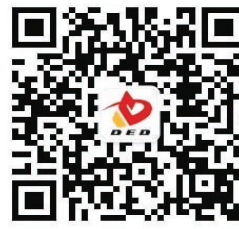
开发区微信公众号