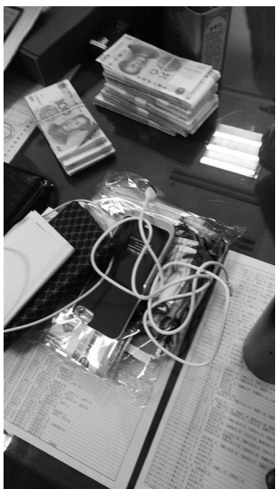
图为手提包内的6万多元现金及其他物品。

本报讯(记者 王国禹 通讯员 陈哲)16日,一只装有6万多元现金的手提包,被放在我市火车站北广场的安检仪旁,一直没有人来拿。这究竟