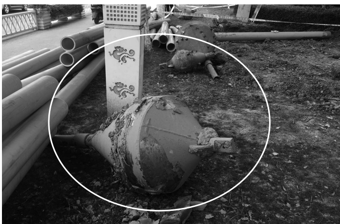
图为顶管机组件。

本报讯(记者 茅猛科)“你们快来看看啊,这里有几个疑似炮弹的东西,放在路边两三天了。”近日,市民蒋女士拨打本报民生热线86983119反映,她这几天上下班,看到迎宾路与开发