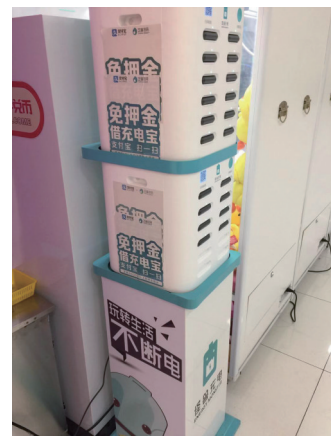
图为商场内的“共享充电宝”柜。