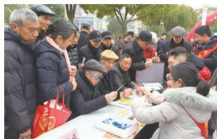
开展“我奉献我快乐,我参与我成长”学雷锋公益活动。通过搭建便民服务台,免费发放爱眼护眼知识传单,免费为市民验光、赠送老花镜等。