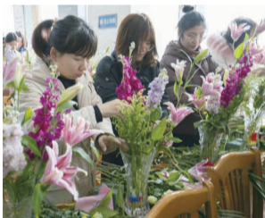
举办“插花飘香”主题活动,丰富女性的文化生活,让妇女同胞们享受亲自创作的乐趣和插花艺术带来的快乐。