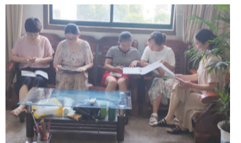
召开妇女议事会商讨守护未来之光活动细节。