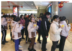
开展“青春助力·情暖童心”“织爱行动·情牵童心”系列活动,促进困境儿童健康成长,让他们感受到社会的温暖。