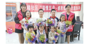
开展母亲节亲子手工插花活动,让社区小朋友懂得以真诚的情感、力所能及的方式去爱妈妈,爱身边的每一个人,学会感恩,也让母亲们感受到孩子成长所带来的快乐和幸福。