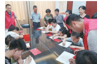
开展“祖国发展我成长”主题夏令营活动,手绘国旗,参观初心体验室“中共一大体验区”,增加孩子们对红色文化的认同感,更好地传承红色基因。