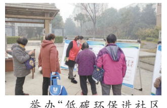
举办“低碳环保进社区生活垃圾分类”宣传活动,增强社区居民对垃圾分类知识的了解,让“绿色、低碳、环保”的理念深入人心,促使社区居民能够积极参与到实践垃圾分类的行动中来。