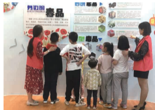
举办青少年科普活动,学习交通指令手势,进行毒品预防教育,宣传防火安全意识等,丰富青少年课余生活,培养青少年科普意识。

高楼社区“三色科普·妇女微家”致力于服务青少年,以社区科普馆为载体,从青少年的需求出发,把科普馆作为科普教育的一种方式,通过讲解、参观等,广泛宣传多种科学知识,在青少年们的心灵播下科学的种子,引导他们树立少年中国梦,努力学习,立志成才,享受科学中的快乐。