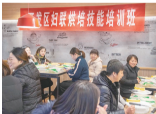
举办烘焙技能培训,提升妇女动手技能,让她们感受到手工烘焙带来的乐趣。