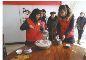
开展“温情腊八·敬老院慰问”活动。将熬好的腊八粥送到敬老院里,希望能为老人们带去温暖。

普善·妇女微家致力于服务辖区内的妇女儿童,将妇联组织的服务延伸到妇女群众生活的最小单元,为妇女儿童提供兴趣娱乐、家庭教育、文化学习、情感呵护、法律维权等特色服务。以“妇女微家”为触角,结合网格化管理,开展细致入微的妇女工作。