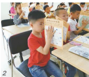
走进大泊幼儿园,关爱幼儿眼健康。

眼镜城“心灵之窗·妇女微家”致力于呵护青少年的眼睛和关爱老年人的视力健康。通过多种途径宣传,一起为保护幼儿明眼的双眼尽心尽力,让孩子们的心灵之窗更加明亮;经常性开展关爱活动,免费为老年人验光、赠送老花镜等。真心呵护心灵之窗!