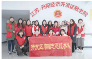
暖心关爱孤寡老人,到开发区敬老院看望老人们,为她们义务理发、免费配镜、打扫卫生、包馄饨等。

曲阿“巾”韵·妇女微家是开发区妇联依托全区巾帼志愿者们共同打造,以帮扶妇女儿童为特色,旨在为全区妇女提供交流、学习、提升的平台,努力为更多妇女儿童送去暖心的服务、构建温馨和谐的家。