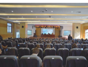
举办“关爱女性、防身有术”专题讲座,强化妇女同胞们的安全防护意识和自我保护能力。