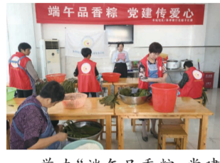
举办“端午品粽·党建传爱心”包粽子比赛,并向老年人和失独家庭送去粽子和节日的问候。