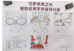
组织少年儿童开展爱眼护眼手抄报比赛活动,加大“守护未来之光”宣传力度,努力营造科学用眼、科学护眼的氛围。

华甸社区“未来之光·妇女微家”致力于服务辖区内的儿童,将妇联组织的家庭儿童服务延伸到群众生活的最小单元。“未来之光·妇女微家”通过举办公益讲座、宣传教育、志愿服务等,还孩子一个明亮的未来,在儿童成长领域奉献着、收获着、成长着。