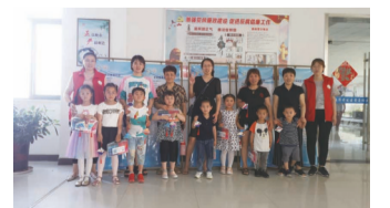
举办制作粽子香囊亲子比赛活动,让幼儿感受端午节丰富的文化内涵,激发初步的爱国主义情感。