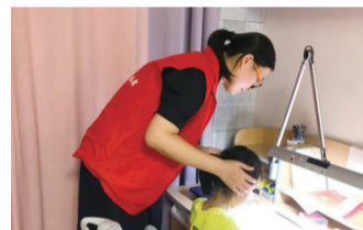
组建家庭教育志愿者队伍,走进家庭,走进学校,指导儿童养成良好的坐姿和阅读姿势等习惯,共同携手守护未来之光。