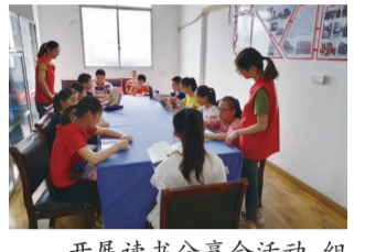
开展读书分享会活动,组织孩子们进行阅读交流,品味阅读带来的快乐,丰富未成年人的暑期生活。