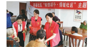
开展“粽情端午·情暖社区”主题慰问活动,提前为老人们送去节日的温暖和祝福。