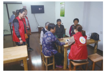
免费为妇女同胞量血压、测血糖。