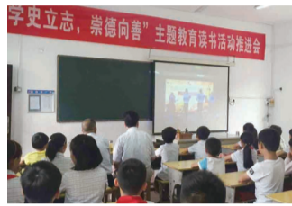
开展“学史立志,崇德向善”主题教育读书活动,勉励流动儿童“好好学习,天天向上”。

车站社区“芳懿·妇女微家”致力于服务辖区内的妇女儿童,建立完善“妇女微家”活动管理制度,规范“妇女微家”的服务和管理水平,进一步提升“妇女微家”的品质。以“妇女微家”为触角,为妇女群众提供无微不至的用心、贴心、暖心的服务,凝聚和吸引妇女群众有事找微家、活动在微家、心聚在微家,让微家成为广大妇女群众的第二个家。