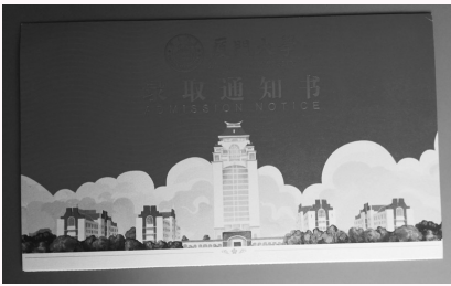
步濡羽的录取通知书。