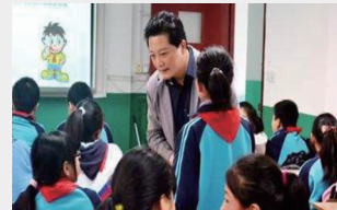
上海一小学内,老师正在进行方言教学

方言作为地区文化最重要的载体,一种语言的消亡意味着一种文化的消亡,而乡音背后的文化基因也在被我们逐渐剪断。因此近年来,在全国范围内,“拯救方言”都成为了一个逐渐热门的话题。而光靠学术层面的记录、保存并不足以挽救方言,更重要的还是让它“活起来”。早在2006年,上海就已经将上海话、上海童谣等加入幼儿园小朋友的日常课程中,并通过游戏等方式融入“乡土文化”的教育,而扬州、海门等地也计划逐步将方言纳入日常课程。丹阳话在吴方言中独树一帜,文化研究价值和传承价值只会高