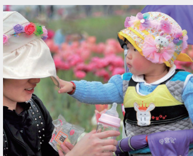
丹阳“10后”接触方言的机会会更少

关于自己的女儿为什么不会说方言,老王认为主要是客观原因造成的:“小孩才学会说话没多久就要开始上学前班了,从那时起老师就会在课堂上和孩子说普通话,同学之间的交流也是普通话。和父母待在一起的时间远远比不上在学校的时间,久而久之就算小孩还能听懂父母之间用方言进行的交流,但自己已经很难再学习和使用方言了。”网友“柒柒”说:“学校是一方面原因,还有一部分家长不允许小孩说丹阳话,认为‘不上台面’,其实这都是错误的观点,学方言对一个人来说不仅是了解家乡文化,也是增加一种归属感。”也有部分网友表示自己小时候被爷爷奶奶带大,所以方言还是会说的。“我就是个丹阳话