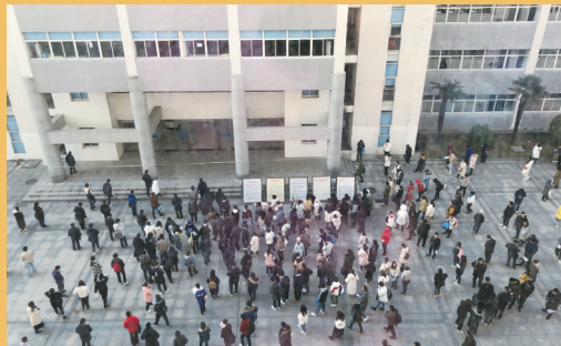
参加江苏省考的考生们正在候场