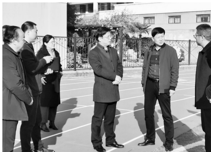
图为陕西富平教育考察团考察云阳学校“县管校聘”工作。

促进了专业发展。校本研训紧紧围绕“自然分材教学”课改,精心安排校本培训内容,通过“理论学习——合作研讨——课堂模板构建——典型引路——专家解惑——总结推广”的思路,研究重点问题,让校本培训真正成为展示教师业务水平,提高业务能力的平台。通过开展扎实的校本研训,教师专业上整体得以提升,走出了一位江苏省特级教师、一位镇江市名校