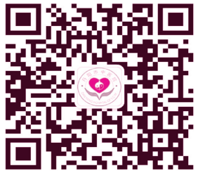
中医院微信二维码

中医院肛肠科特别提示,在我国,肛肠病的发病率为80%~95%。如果出现便血、排便困难、瘙痒、疼痛等类似“痔疮”的症状,不能盲目硬扛或是服药敷衍,越早就诊越有利于病情的治疗。