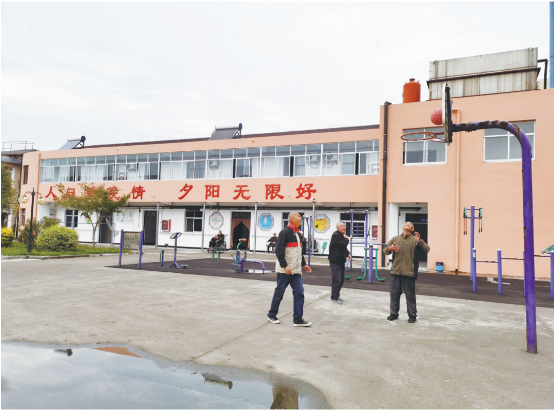
图为导墅镇敬老院内老人在打篮球。记者 郡玉 摄

加大居家养老服务的补贴力度。每年投入1200万元对全市60周岁以上的低保、五保、重点优抚等特殊对象中失能、半失能的,给予每人每月600元或400元的居家援助服务。在全省率先将80周岁以上高龄老人全部纳入政府购买居家养老服务范畴,每户每月提供60元的居家援助服务,覆盖人群达老年人口的14%。通过政府对高龄老人的“小”投入,引导撬动了更多社