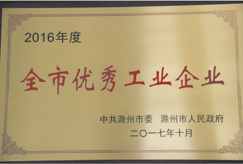
公司获得滁州市委、市政府颁发的优秀企业荣誉称号

2017年,中盐东兴公司在定远县委、县政府的坚强领导下,认真落实中盐总公司年度工作会议精神,紧紧围绕年度重点工作,抓管理,拓市场,调结构,促发展,有效应对盐业体制改革带来的挑战和考验,在极其复杂的市场环境下,较好地完成了年度既定目标。全年实现盐硝产量157.03万吨,与去年基本持平;实现销售量159.56万吨,同比增长1.58%;实现营业收入65418万元,同比增长25.65%;利润总额10231万元,同比增长35.44%;实现税费10034万元,同比增长11.29%,各项经济指标再次攀升,生产线升级和集控改造项目稳步推进,基础管理再上新台阶,党的建设和文化建设取得新成效,企业新的市场环境下保持着强劲的发展势头。