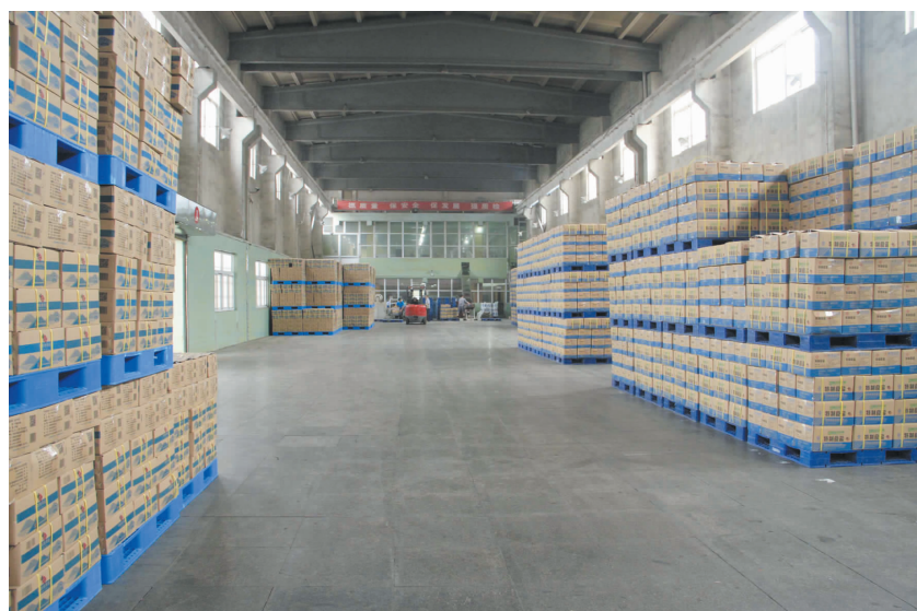
整齐堆码的盐产品