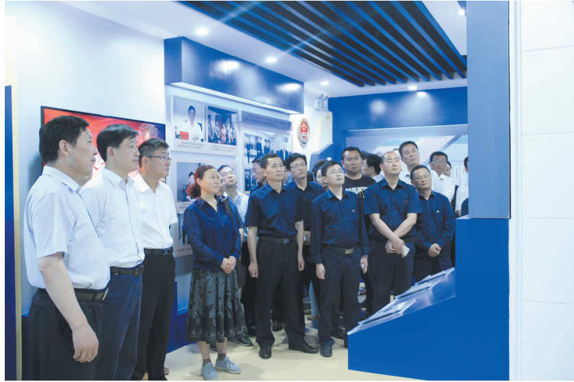
公司党委组织党员领导干部前往县检察院反腐教育基地接受警示教育