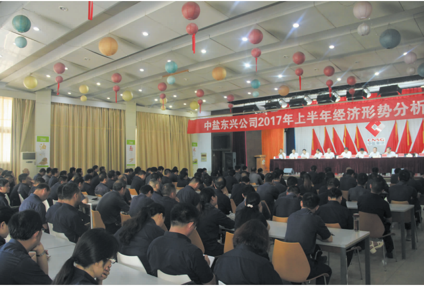
2017年7月公司召开上半年经济形势分析会