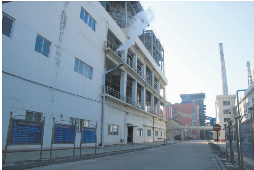
公司生产区的场景