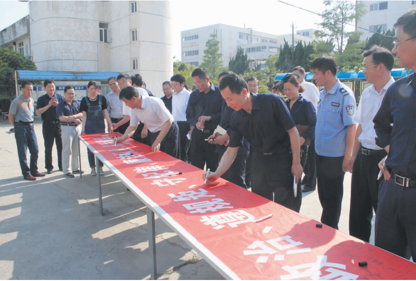
纪律规矩教育月期间公司党委组织开展百名党员作承诺签名活动的现场