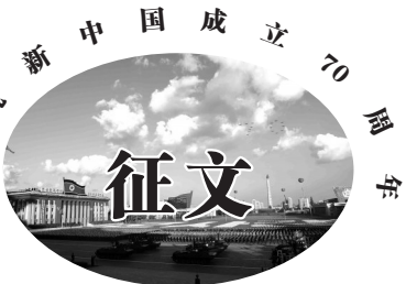
凤台县作家协会 《凤凰台》报编辑部 合办

今天，怀揣一颗中国心 我只想站在 鲜艳的五星红旗下 凝望窗前一张中国地图 以虔诚的赤子之心 向新中国深深地鞠上一躬 以代表我的万语千言 祝福亲爱的母亲 钢铁般的硬朗，花一样的美丽