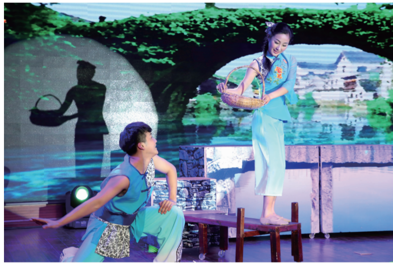
南通市文艺工作者首次在刚投入使用的文艺之家欢聚一堂,举行联谊会。

本报讯 塔影染新绿,春韵含佳音。3月16日下午,南通市文联举办“塔影春韵”南通市首届文艺界新春联谊会,这是全市文艺工作者首次在刚投入使用的文艺之家——南通文艺之家欢聚一堂,第一次在自己的“家里”欢度新春共话友谊。