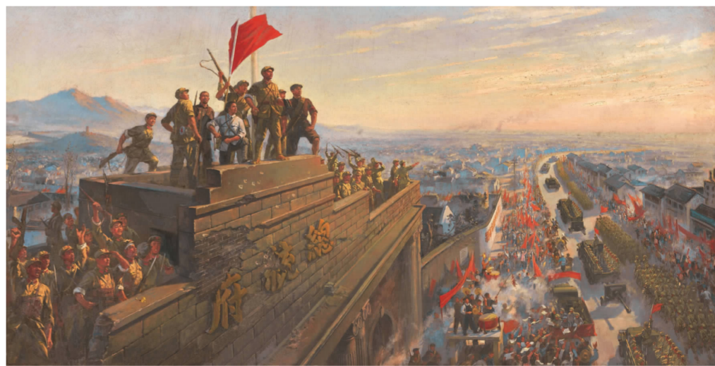
《人民解放军占领南京》1970年