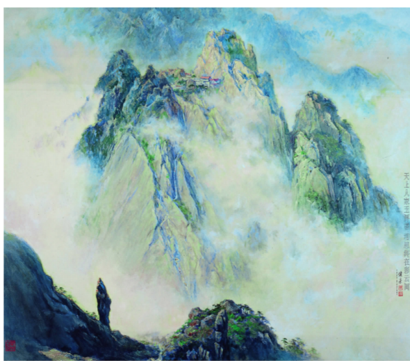
《相思终在彩云间》1997年