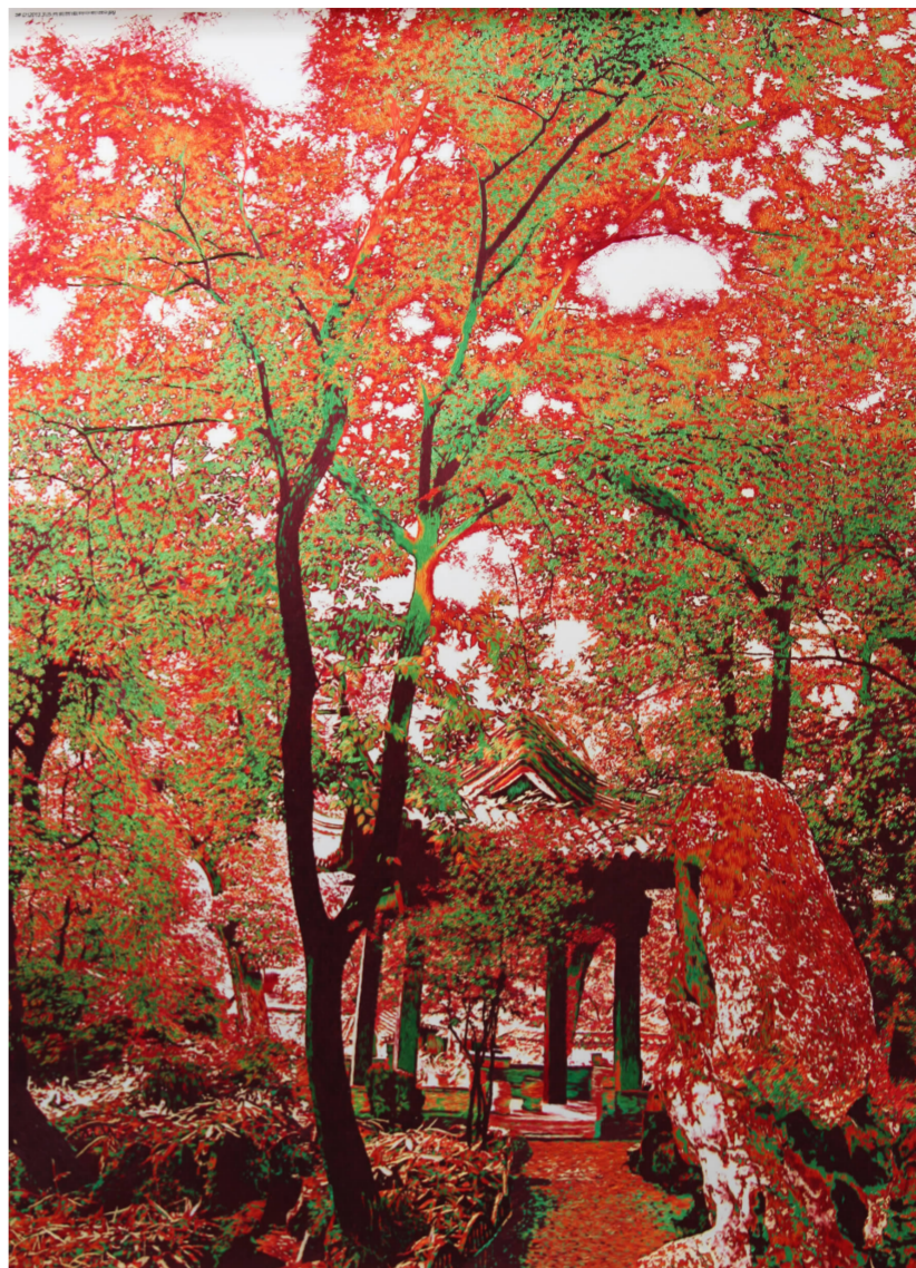
左上:《园林组画之虎丘塔》 右上:《园林组画之城市山林》

在当下苏绣艺术界,姚惠芬无疑是一位多才多艺具有开创性的新一代艺术家。早在1995年,她就凭着一幅形神兼备的《张大千肖像》荣获了“首届中华巧女手工艺品大赛”一等奖,被誉为“中华巧女”,由此,她开始担当起了当代苏绣领军人的角色。