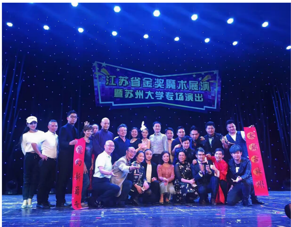
参加江苏省金奖魔术展演