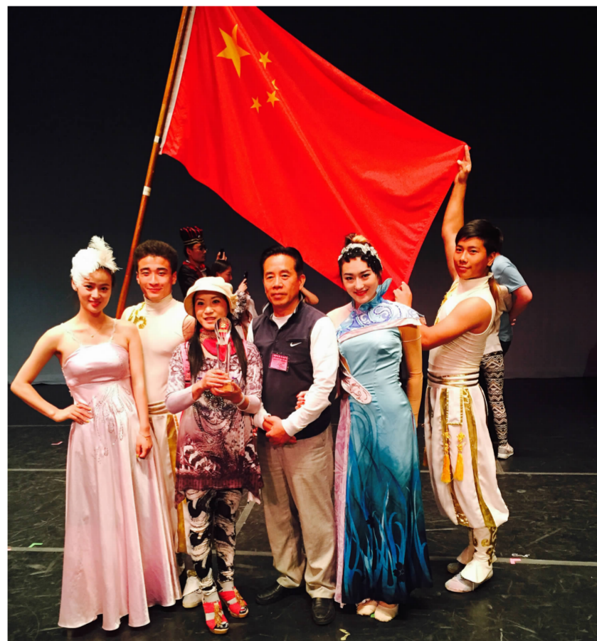
第三十届美国夏季国际艺术节银奖颁奖现场