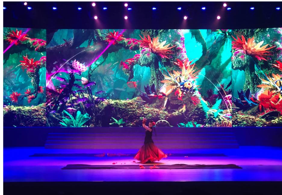
魔术《花儿为什么这样红》剧照