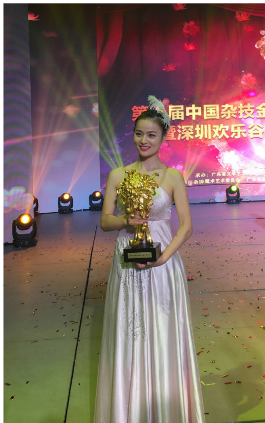
中国魔术比赛最高奖——第十届中国杂技金菊奖魔术节目奖颁奖现场