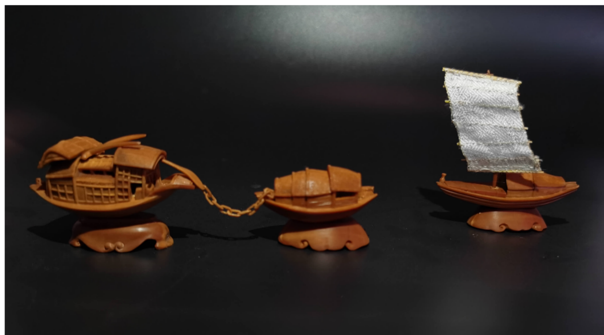
核雕《扬帆起航》设计:姚思颖 制作:陆小琴