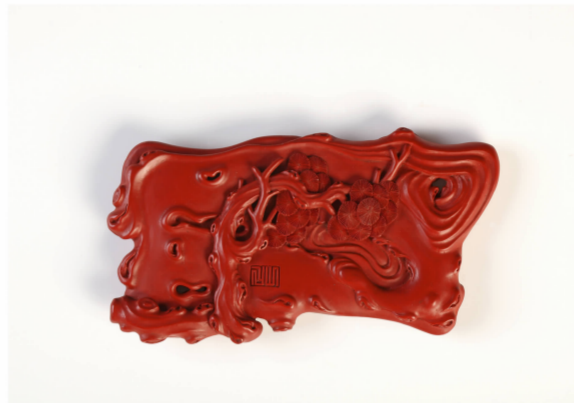
漆雕《文房四件套》设计制作:张来喜