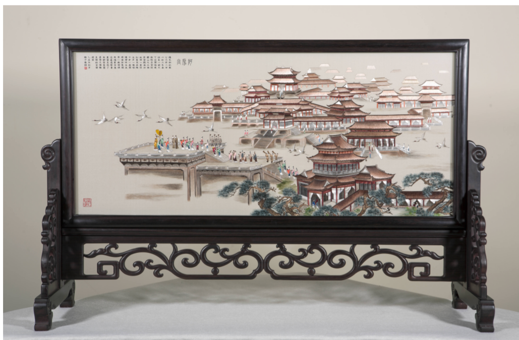
双面精微绣《阿房宫》设计:金家翔 制作:赵红育