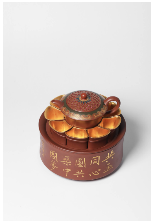
紫砂《心向往阳》设计制作:季益顺