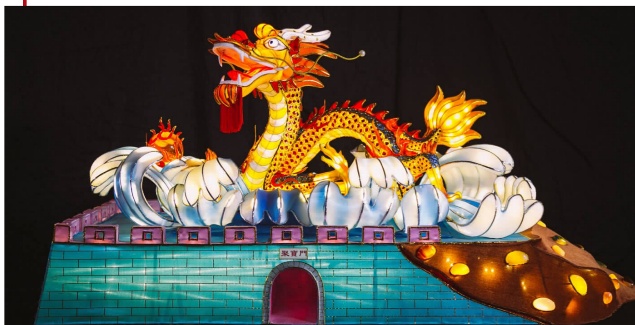
秦淮灯彩《龙腾金陵》设计制作:毛金海