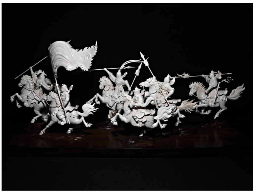
猛犸牙雕《八千里路云和月》设计制作:王中帮