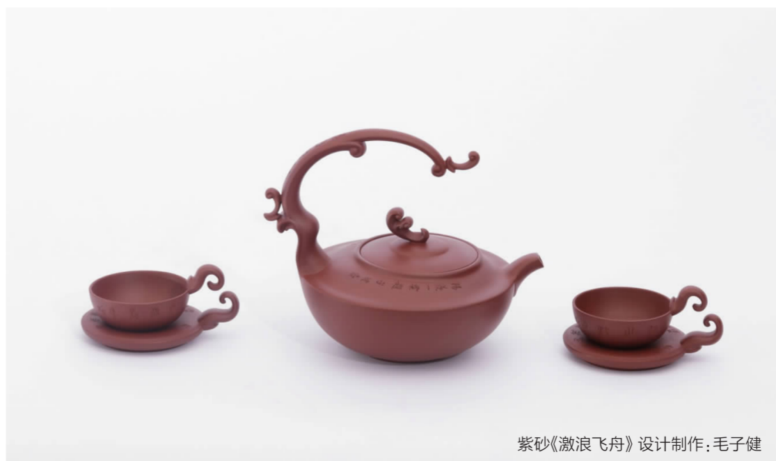
紫砂《激浪飞舟》设计制作:毛子健