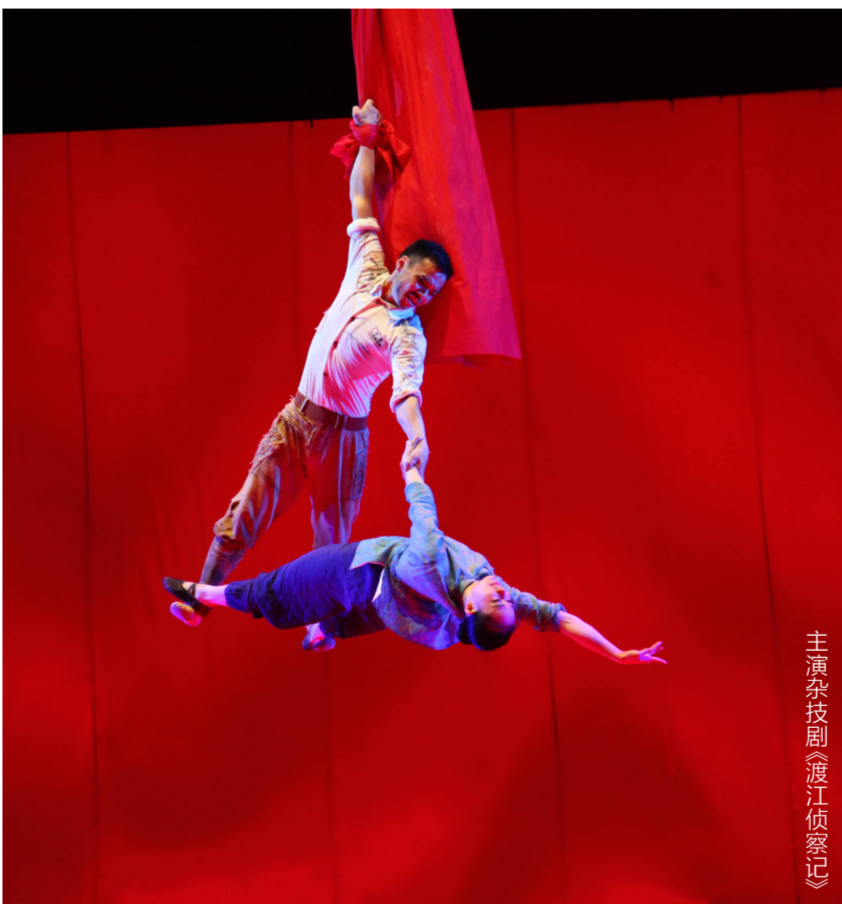
主演杂技剧《渡江侦察记》