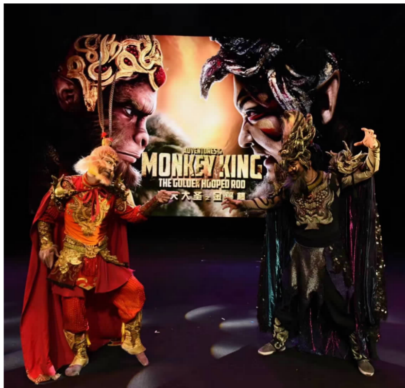
主演杂技剧《金箍棒》

但凡接触文化,必定会随时代的发展而改革创新,杂技艺术的文化需要在一定的基础上保持原有的独特性进行创新,从现代人们的视角进行思维以及理念的创新。创新型的杂技艺术,可以突破现有杂技艺术所存在的发展困境,为杂技艺术的发展奠定良好的文化基础,最终适应市场环境以及人们的需要。