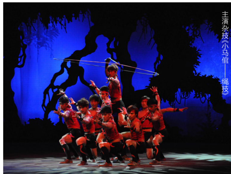
主演杂技《小马信》——绳技