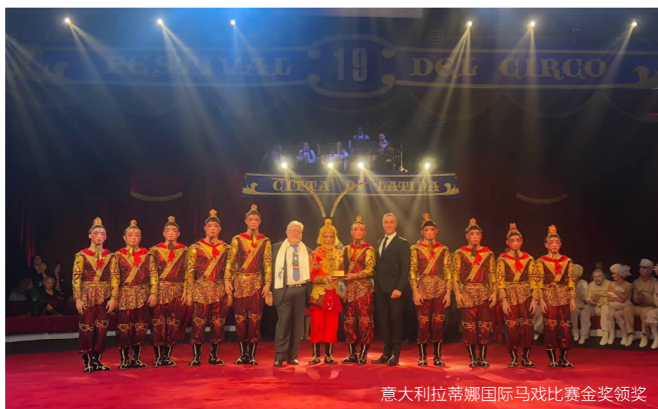
意大利蒂蒂娜国际马戏比赛金奖颁奖