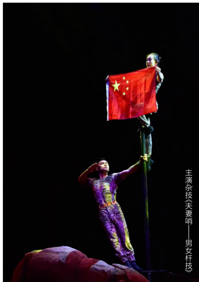
主演杂技《夫妻哨》——男女杆技

多元化的杂技艺术发展是当前我国杂技艺术发展的主要目标,杂技文化也需要与时俱进,在当前文化及驱动视域下的杂技文化需要不断地进行创新和技术的提升,才能适应现代观众们的需求,从而提高社会对杂技文化的认可。