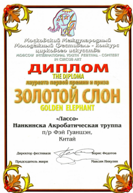
俄罗斯国际马戏节金象奖证书