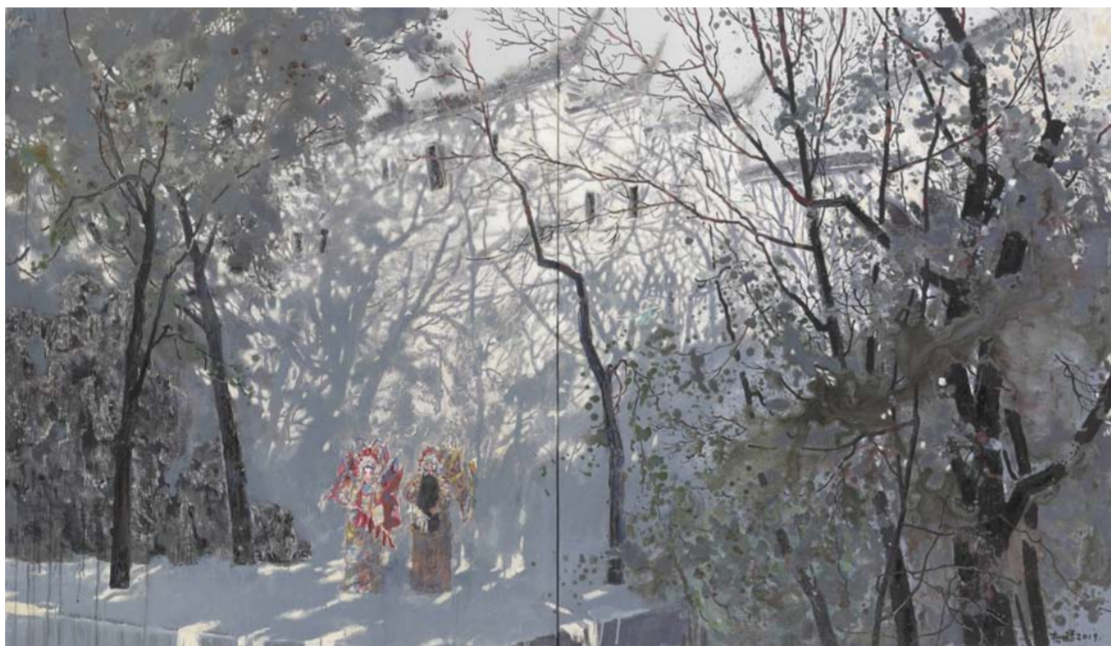
《真象·幻象》杨明清 湖北省 120cm x 200cm