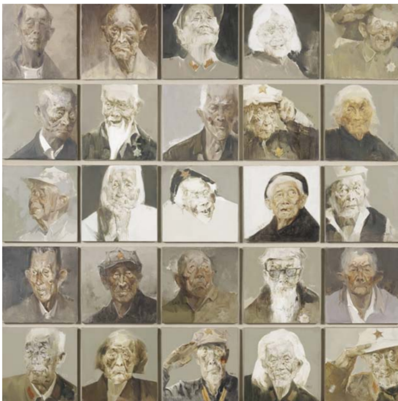
《开国英雄谱》张永 江苏省 200cm x 200cm