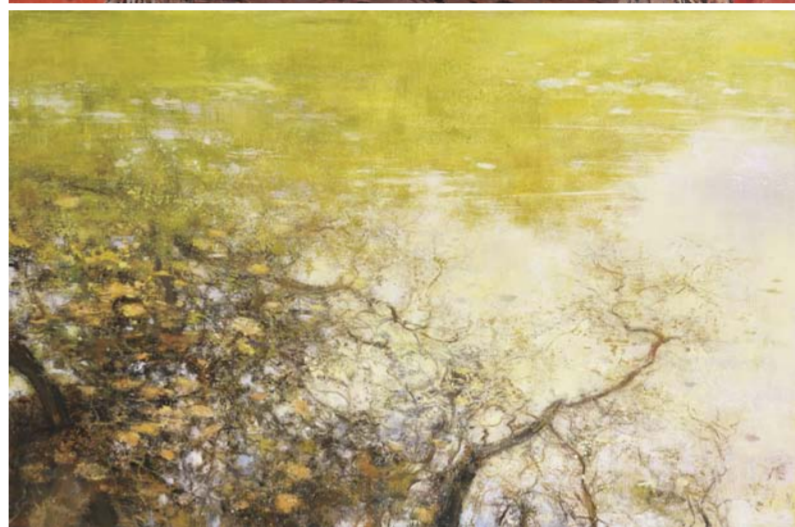
《山水清晖》庄重 江苏省 130cm x 194cm