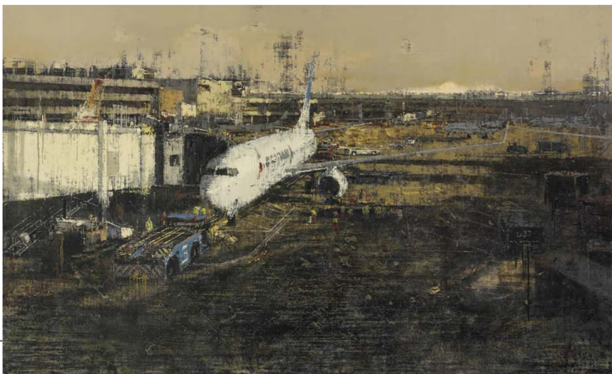
《梦和远方(二)》徐刚 湖南省 110cm x 180cm