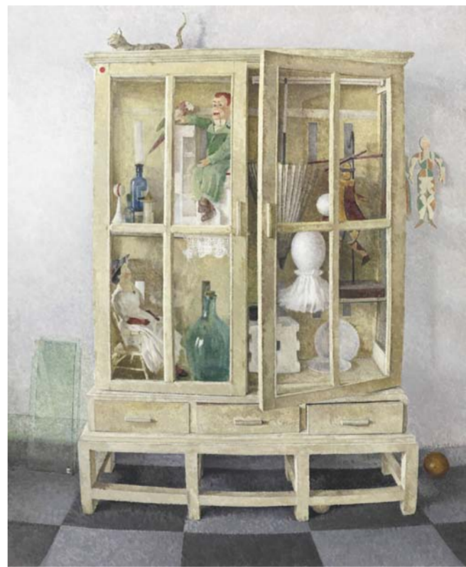
《玩物》金文 浙江省 185cm x 150cm