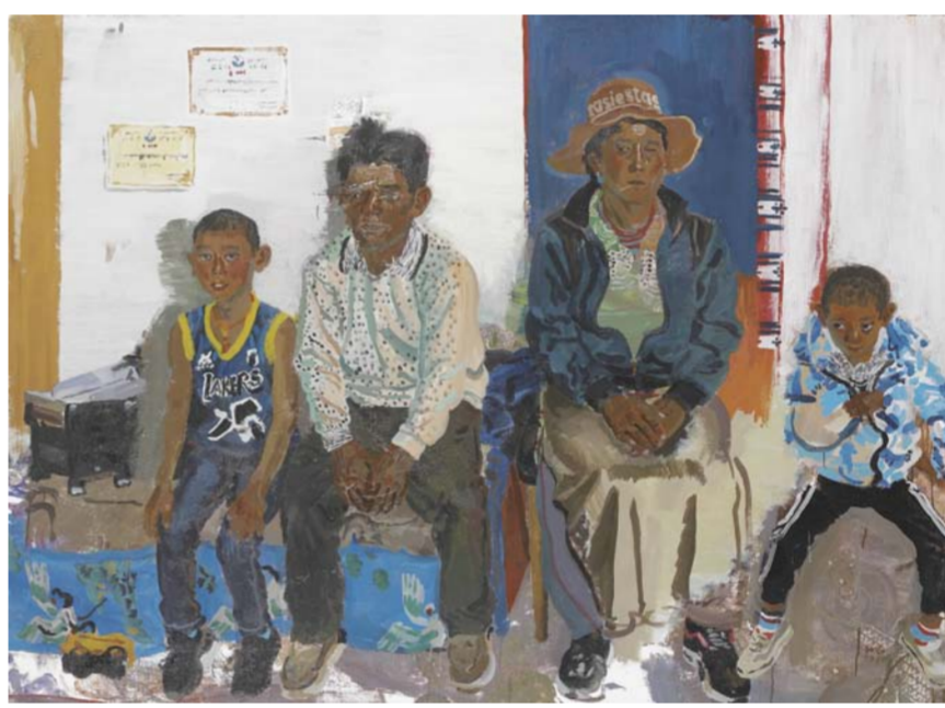
《回家》何光 广西壮族自治区 150cm x 200cm