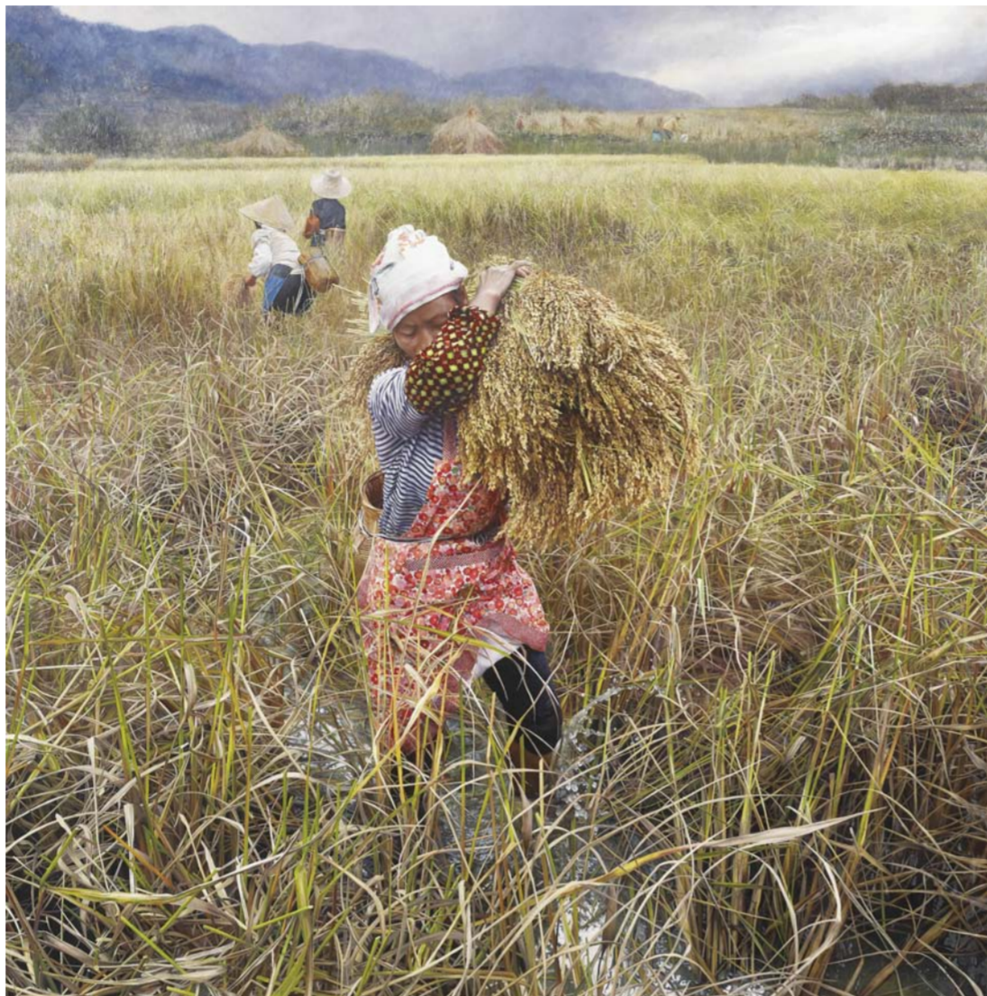
《沉甸甸的糯稻》王驰 江苏省 170cm x 170cm

编者按: 由中国美协、中共江苏省委宣传部、省文化和旅游厅、省文联主办, 省美协、省美术馆、省书画院承办的“百年梦圆——2020·中国百家金陵画展”于11月17日在江苏省美术馆开幕。今年适逢全面建成小康社会的历史节点, 本届展览以“百年梦圆”为主题, 共收到全国各地美术家参评作品3920件, 经过严格的评选, 最终选出10件典藏作品、10件收藏作品、100件入展作品。这些作品, 从题材上讲, 内容丰富, 有城市新貌, 有农村图景, 有典型人物, 有普通百姓; 从艺术上讲, 风格各异, 有工笔写实, 有抽象写意, 有工写结合。现选取典藏作品刊登, 以飨读者。