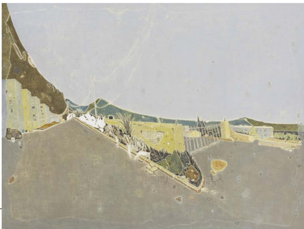
《山城记忆》戴家峰 江苏省 120cm x 160cm