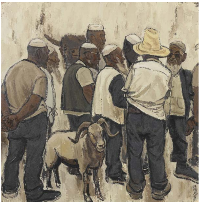
《黑白牧歌曲》王鹏 上海市 200cm x 200cm