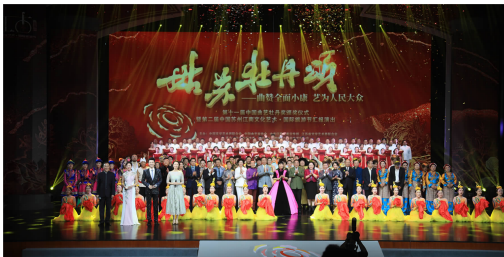
2020年10月15日,姑苏牡丹颂——“曲赞全面小康”艺术为人民大众”第十一届中国曲艺牡丹奖颁奖典礼在苏州举行。