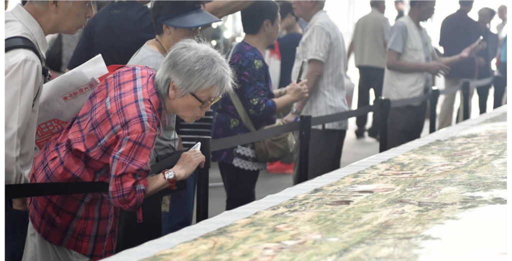
2018年4月20日,由江苏省人民政府、香港江苏社团总会、江苏旅港同乡联合会主办,江苏文联等承办的“水韵江苏”相约香港——江苏文化嘉年华”在香港维多利亚公园开幕。

五年来,江苏厚植文化沃土,培塑文艺人才、催生文艺平台,文艺生态愈发郁郁葱葱,一片繁荣态势。 按照省委提出“采取超常规措施培养青年文艺人才”“推出文艺名家”等要求,江苏省委文联通过打造全国文艺品牌、加大政策支持力度等,为文艺人才加快成长创造条件。 江苏省委文联坚持把文艺人才队伍建设放在突出位置,多措并举,为文艺界新生力量脱颖而出创造机会、搭建展示才华的舞台,为他们通向“名家大家”筑桥铺路。精心实施江苏文艺“名师带徒”计划,专门制定管理办法和配套措施,推行师徒联展、集中展演等年度考核方式。这一计划取得了积极成效,一大批青年文艺家由此进入全国全省视野,4位高徒获得全国最高奖项。 繁荣文艺创作,推动文艺创新,必须有大批德艺双馨的文艺名家。以“江苏文艺名家晋京展”为抓手,江苏文联积极推动江苏文艺名家“走出去”,先后为“紫金文化奖”获得者冯健亲、孙晓云、石小梅、顾少王、朱自耀、高云等在京举办专场展览展示,有力提升了江苏文艺和艺术家的知名度、影响力。 文化建设的建设不仅需要造就一批有影响