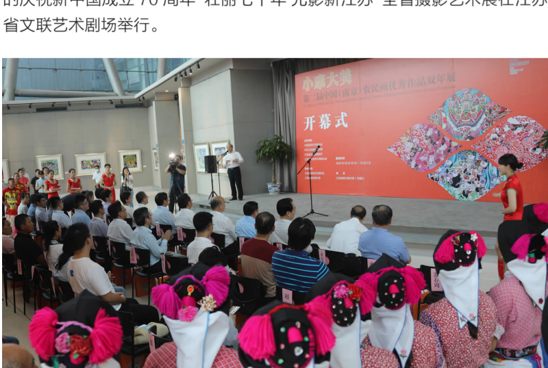
2020年9月30日,由中国民协、中共江苏省委宣传部、江苏省文化和旅游厅、江苏文联主办的“小康大美——第二届小康(南京)农民画优秀作品双年度展”开幕式在江苏现代美术馆举行。