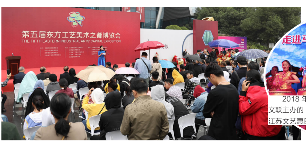
2019年10月25日,由中国民协、中共江苏省委宣传部、江苏省文化和旅游厅、江苏文联主办的“大美民间”盛世绽放——第五届全国工艺美术之都博览会在江苏省现代美术馆开幕。