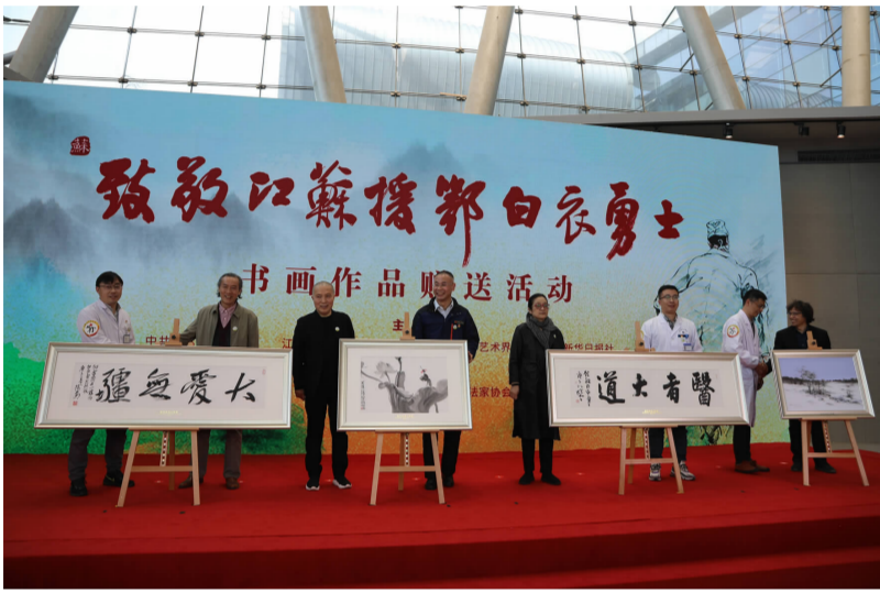
2020年4月16日,举办“致敬江苏援鄂白衣勇士”书画作品赠送活动。