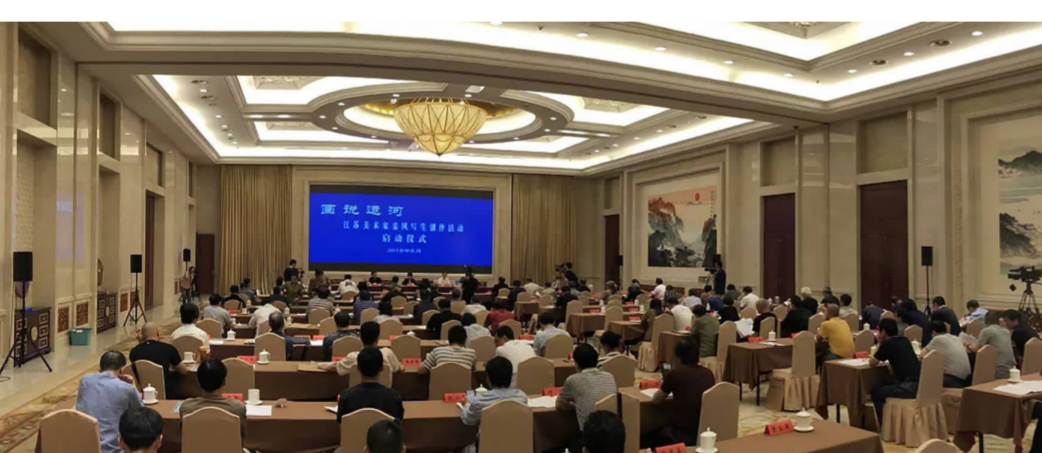
2018年6月,“画说运河——江苏美术家采风写生创作活动”启动仪式在宁举行。