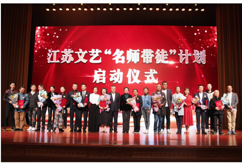
2019年4月,江苏文艺“名师带徒”计划启动仪式在江苏大剧院举行。