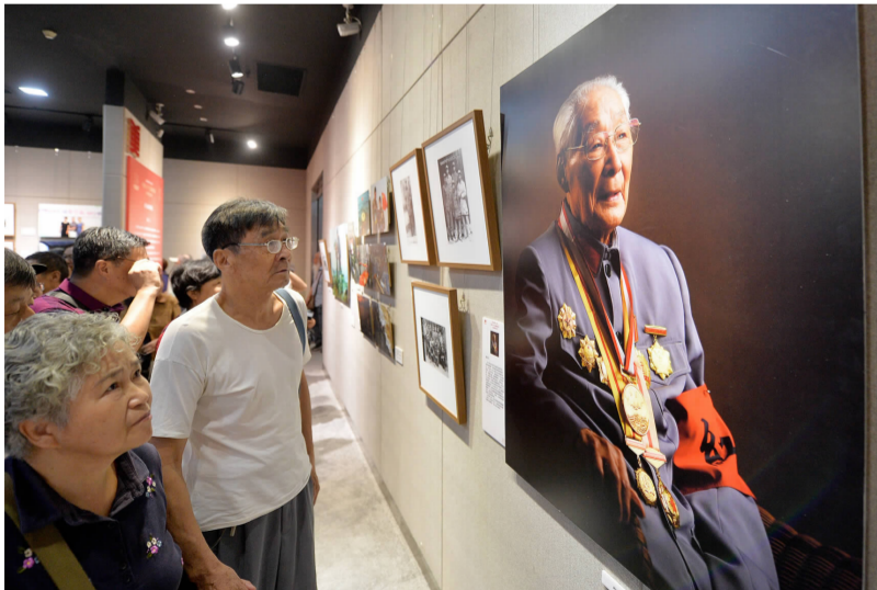
2018年6月,“画说运河——江苏美术家采风写生创作活动”启动仪式在宁举行。