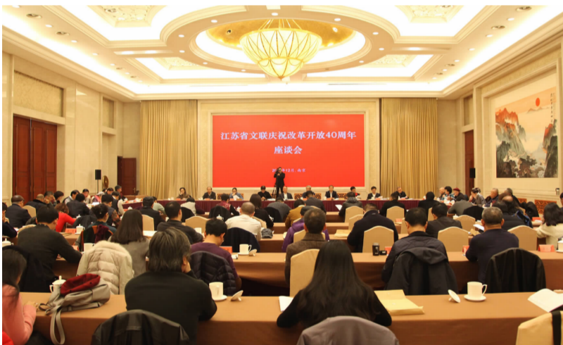
2018年12月,江苏省委省政府召开江苏文联系统纪念改革开放40周年座谈会。