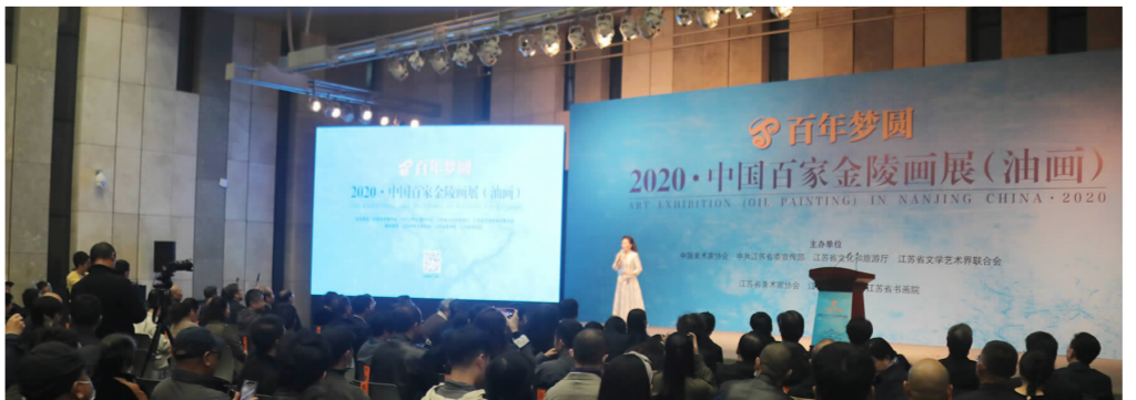
2020年11月17日,由中国民协、中共江苏省委宣传部、江苏省文化和旅游厅、江苏文联主办的“百年圆梦——2020·中国百家金陵画展”在江苏美术馆开幕。