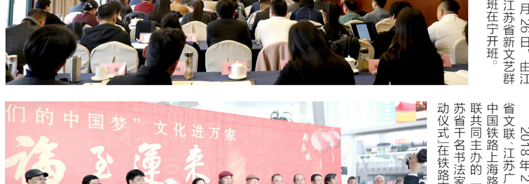
2018年2月11日,由江苏省文联主办,江苏文艺界文艺家群体、省铁路上海段文艺家群体、南京艺术学院文艺家群体等共同参与的“我们的中国梦”文化进万家活动在南京站举行。