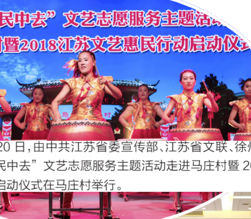
2018年5月20日,由中共江苏省委宣传部、江苏文联、徐州市文联主办的“到人民中去”文艺志愿服务主题活动走进马庄村暨2018江苏文艺惠民启动仪式在马庄村举行。

芬芳硕果,砥砺前行。五年的砥砺前行,充分体现出江苏文艺事业的勃勃生机,展示了江苏广大文艺工作者昂扬向上的精神风貌,更为构筑文艺精品创作高地积累了宝贵经验,也为建设文化强省奠定了坚实基础。 当前,全省上下正在深入学习贯彻习近平总书记视察江苏重要讲话精神,按照总书记提出的“争当表率、争做示范、走在前列”的要求,系统谋划江苏“十四五”乃至更长时期的发展,全面审视全省工作的目标取向、理念思路、部署举措,切实肩负起这一时代重任,呼唤着江苏文艺界勇立潮头、勇当先锋,以更加鲜明的导向、更加清晰的路径、更加有力的措施,提升江苏文艺工作的组织推动力、落地保障力、品牌影响力,凝聚起新时代文艺高地的蓬勃力量,创作更多无愧于时代的优秀作品,为民族复兴大业贡献强大精神力量。