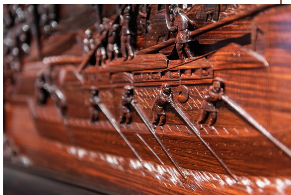
《姑苏繁华图》局部三