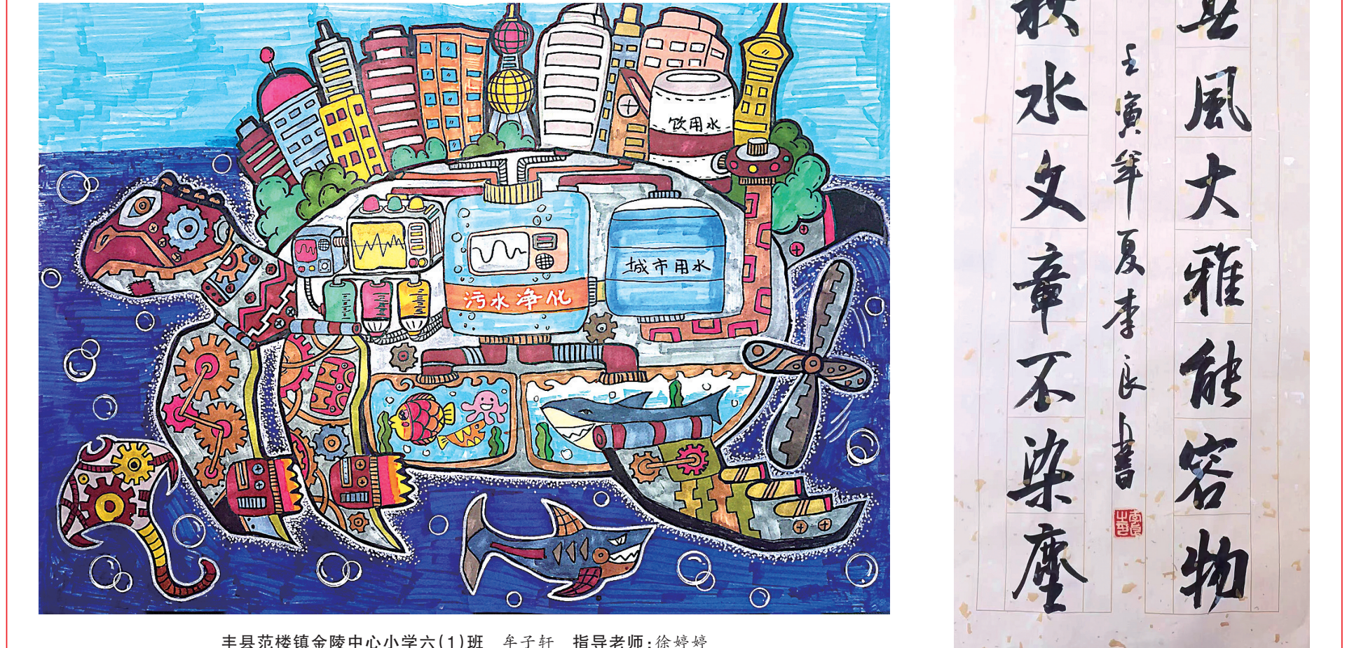
丰县范楼镇金陵中心小学六(1)班 车子轩 指导老师:徐婷婷