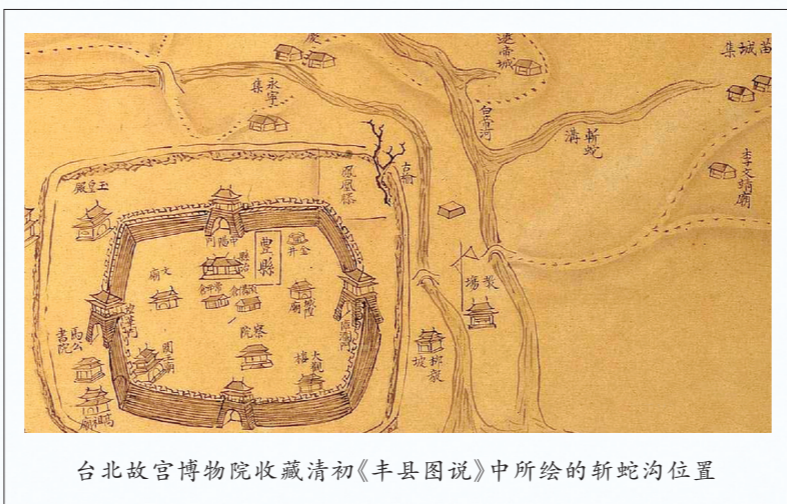
台北故宫博物院收藏清初《丰县图说》中所绘的斩蛇沟位置

如果对丰县及丰县周边的古水系没有深入研究,读懂这段文字有点费力。其大概意思是:从杼秋县界北流的瓠卢沟进入丰县西南境内称丰水,也称二泡,从平乐县东流至丰县西南境内的称泡水,丰水与泡水都流入丰县西南的大泽中。然后又从大泽的东堰分出两条河流:一条在南,即丰水,丰水经城南区域向东北流去;一条在北,即枝水,枝水东流不久即在城南与合二为一。而枝水又分出一条支流泡水,泡水蜿蜒流经城北,继续向东。最终,城南的丰水与城北的泡水在丰县