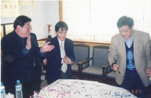
2000 年 3 月,著名曲艺家赵连甲接受了“古贝春有限公司高级顾问”的聘书,并题词:情系古贝春。

赵连甲晚年从事的另一项工作就是整理曲艺著作。几十年的耕耘,赵连甲创作改编了 400 余篇曲艺作品,还撰写了大量曲艺理论文章。从 2006 年开始,他搜集、整理,编写了《中国传统山东快书大全》、《中国传统西河大鼓鼓词大全》等 5 部著作,为《中国相声大全》提供了重要资料。2000 年,中国曲艺家协会授予他“新中国曲艺 50 年特别贡献曲艺家”荣誉称号;2014 年,赵连甲获得“中国曲艺牡丹奖终身成就奖”。2019 年,赵连甲再次来到古贝春公司,当谈起这些荣誉时,他说:“曲艺工作者就是要用作品说话,就像人们听到‘当里格当’就想起山东快书一样;若干年后,当人们说到曲艺就能想起有一个姓赵的老头儿,那就是我最大的欣慰。”(文化中心顾问)