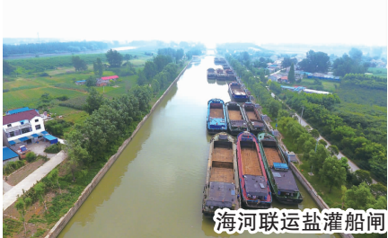
海河联运盐灌船闸