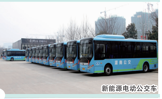
新能源电动公交车