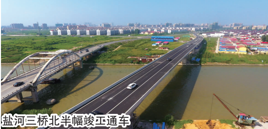
盐河三桥北半幅竣工通车