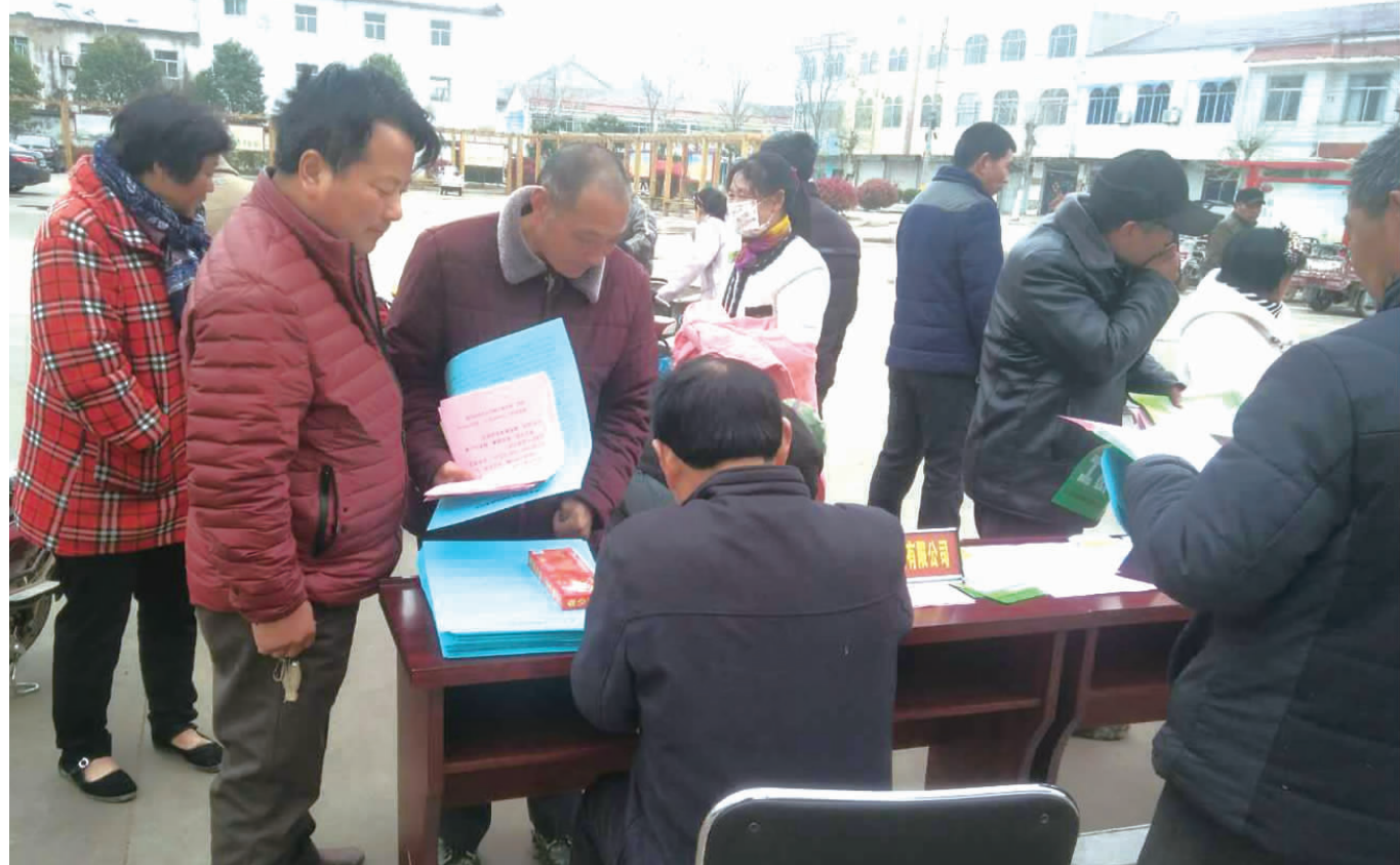
近日,张店镇举办2019“春风送岗位”暨脱贫攻坚专场招聘会,积极为张店镇低收入户提供工作机会,促进基层群众全面脱贫致富。