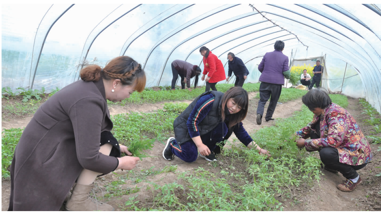
4月11日,田楼镇大莽牛村蔬菜瓜果育苗基地,村民们在争相购买瓜苗回家栽植。

4月12日,县小红花幼儿园举行了以“筝舞红花 放飞梦想”为主题的第二届风筝节,让孩子们在制作风筝的过程中了解祖国的传统文化。在现场,孩子们在家长的陪伴和老师指导下,三个人自由组合,共同完成了风筝的制作、组装和涂色,整个活动其乐融融,孩子们自己动手动脑,充分发挥各自的想象力,既考验了孩子动手实践能力,又增强了亲子合作意识。