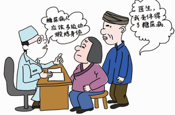
18. 关注血糖变化，控制糖尿病危险因素，糖尿病患者应当加强自我管理。