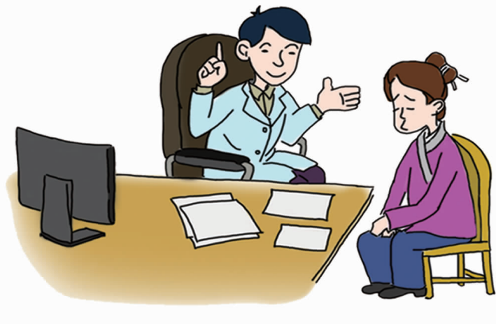
20. 每个人都可能出现抑郁和焦虑情绪，正确认识抑郁症和焦虑症。