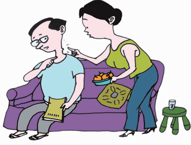
19. 积极参加癌症筛查，及早发现癌症和癌前病变。