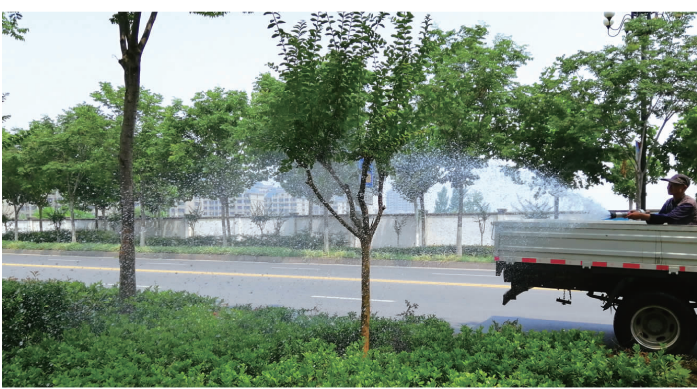
连日来，天气持续高温炎热，给园林植物带来严峻考验的同时，也给园林养护管理工作增加了难度。县园林处工作人员及时调整工作时间，科学合理地安排排水时间。避开中午高温时段，改为上午6时到10时，下午16时到19时。图为园林工人正在给园林植物浇水。

本报讯 连日来，堆沟港镇切实加强家风民风乡风建设，积极推进喜事新办、丧事简办、破除封建迷信，反对盲目攀比，努力形成崇尚文明、勤俭节约的良好风尚。 以头队、二队两个村为试点，充分发挥村级党组织主体作用，深入开展“崇尚勤俭节约、倡导移风易俗”活动。在试点和推广过程中，该镇大力开展移风易俗主题教育活动，通过建立红白理事会、强化移风易俗活动载体建设、组织治理奢侈浪费行为、党员带头倡导树新风等形式，进一步在全镇上下培育孝悌和善家风，倡树婚丧嫁娶新风，营造文明和谐乡风。 “通过这项全民性的活动，让文明乡风走进千家万户，使婚事新办、丧事简办、孝亲敬老、爱护环境、邻里互助、文明礼仪等在全镇蔚然成风，传统美德得到进一步传承和发扬。”该镇宣传委员说。 (胡可群 翟玉军)