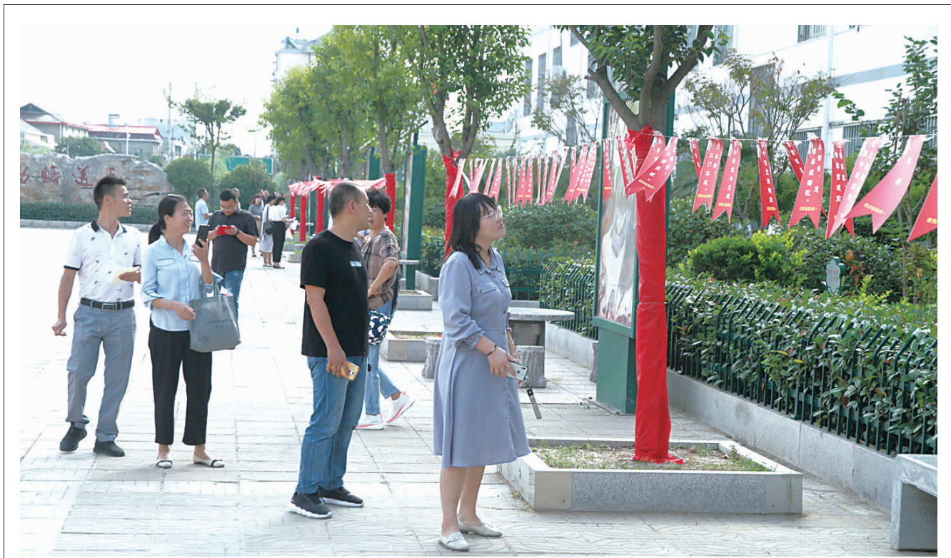
为庆祝第35个教师节,县第四中学联合县谜语协会开展校园谜语竞猜活动。谜面挖掘校本课程资源,深度打造书香

该镇坚持“为官一任,重教一方”的教育管理理念,在领导体系、制度建设、行动落实与社会支持方面为教育发展提供全方位的保障。每逢教师节、春节等重要节日,镇里都召开教师座谈会,组织专门人员深入各校与教师家中进行走访,了解学校教育发展的近况和学校建设中遇到的困难、问题和意见建议,及时将了解到的情况与意见提交镇三套班子会议进行会商、决策。同时,带上慰问金对全镇教师进行慰问。组织派出所干警以及综治办、安监所工作人员对学校基础设施安全、食品安全、校车安全等进行检查,对学校存在的安全隐患提出合理性整改意见。着力清理整治学校周边的社会治安、环境卫生和学校门口两侧电子游戏厅、网吧,努力营造良好的教育教学环境。