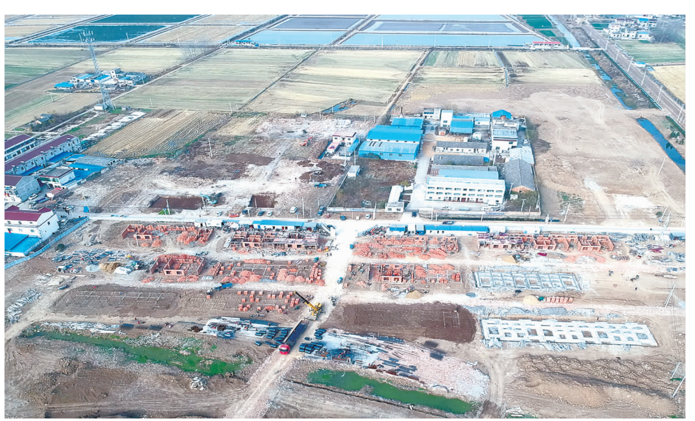
记者日前在孟兴庄镇白皂村新型农村社区建设工地看到,施工工人正在对一期工程进行抓紧施工,预计12月15日前将完成6栋80户,整个工程将于明年5月底竣工交房。

会议期间,与会代表还实地观摩了郝圩村、于圩村、大庙村、小庙村、武庄村、武障河村、闸北村的人居环境整治工作。代表们纷纷表示,将以大会确定的奋斗目标为方向,认真履行代表职责,顽强拼搏,为推动新安镇经济社会发展做出更大的贡献。