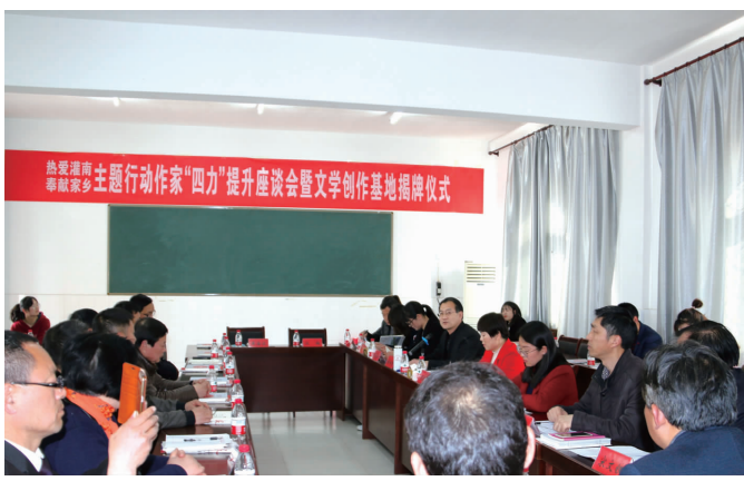
“热爱灌南 奉献家乡”主题行动作家“四力”提升座谈会暨文学创作基地揭牌仪式在田楼中心小学举行