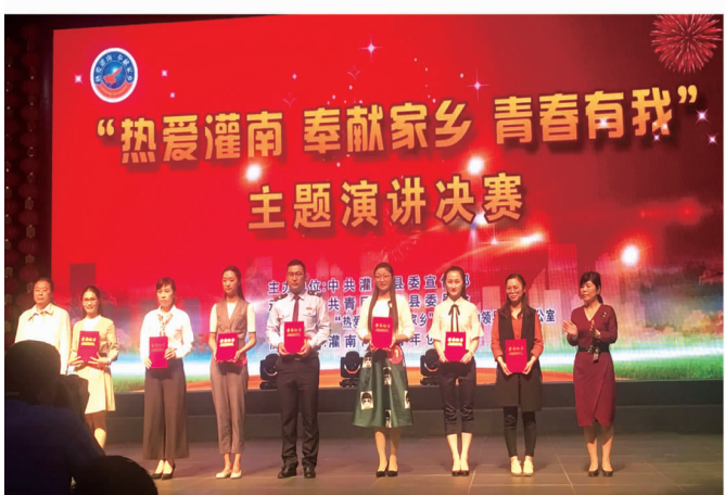
“热爱灌南 奉献家乡”演讲比赛