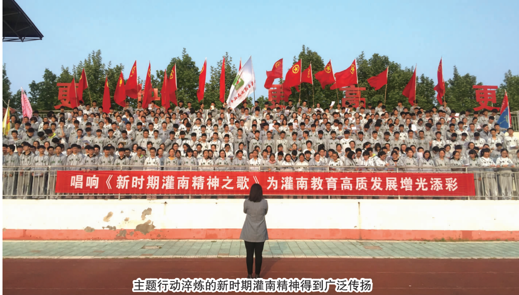
主题行动淬炼的新时期灌南精神得到广泛传扬

自2017年起, 我县利用三年时间扎实开展了以“亲情、友情、乡情”为纽带, 以实施“八大行动”为引领的“热爱灌南奉献家乡”主题行动, 现已完美收官。这三年里, 主题行动波澜壮阔、战果辉煌, 全面激发了灌南儿女热爱灌南、奉献家乡的情感情怀, 为推动灌南跨越振兴注入强大的精神动力和发展合力, 形成了有一定影响力的“灌南品牌”“灌南样本”。