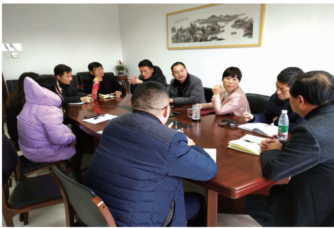
为主题行动总结大会演出多次研讨安排