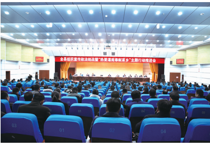
主题行动推进会持续推进活动热烈开展