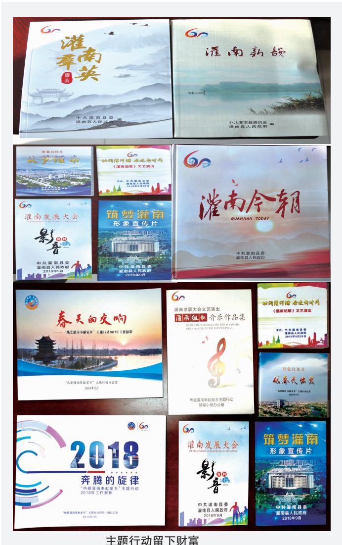
主题行动留下财富