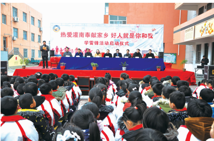
主题行动统领之下, 各类子活动繁花盛开