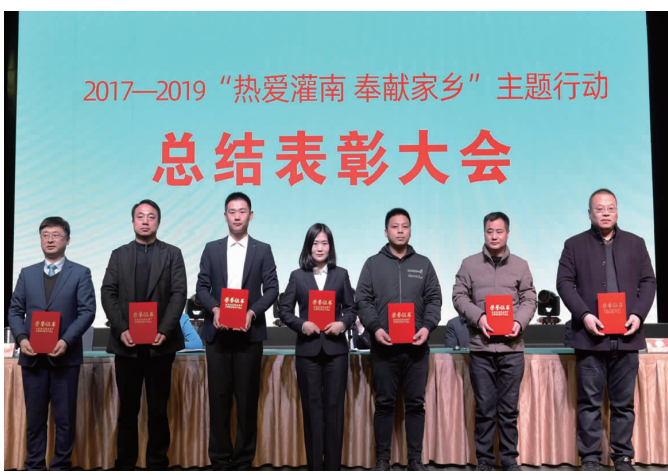
2017—2019“热爱灌南 奉献家乡”主题行动获奖人员

“热爱灌南 奉献家乡”主题行动虽已完美收官, 但热爱灌南、奉献家乡的光荣实践永远在路上, 热爱灌南、奉献家乡的情感情怀永远镌刻在灌南人民的心上。全县上下定会继续高举热爱灌南奉献家乡的精神旗帜, 延续主题行动带来的作风、好的做法, 勠力同心, 一往无前, 共创灌南更加美好的时代!