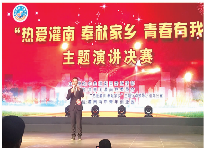
热爱灌南 奉献家乡主题演讲比赛