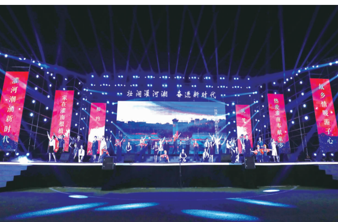
“灌南组歌”唱出灌南人自信自豪