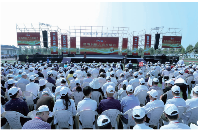
灌南发展大会彰显灌南影响, 凝聚发展智慧与力量