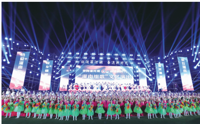
“灌南组歌”唱出灌南人自信自豪