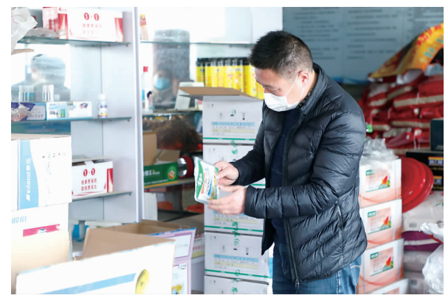
2月26日,县综合行政执法局坚持疫情防控与服务春耕两不误,组织人员提前准备、靠前服务,对城区和镇村的农贸市场进行检查,要求商家做好防护消毒的同时,加大对进货渠道监管,对销售物品进行登记,确保所销售的种子、化肥有法可依、有章可循。