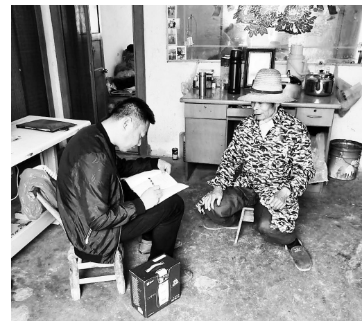
▲乡干部入户宣传移风易俗

建设,对于长期存在的一些陋习弊端,必须坚持走群众路线,把群众的问题交给群众自己解决。多次组织召开村民群众代表大会,积极引导村民主动参与讨论和制定村规民约,将“崇尚科学、移风易俗、反对迷信、勤俭节约”等内容纳入村规民约,成为每个村民都必须遵守的标准。村民委员会或村组理事会指导管理红白喜事,严格控制规模,力求节俭。