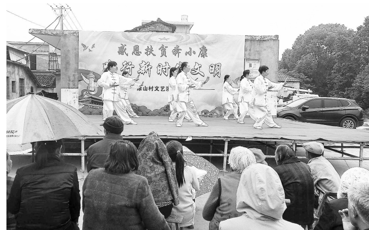
▲泽泉乡村舞台文化活动丰富