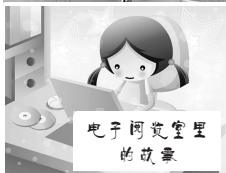
电子阅览室里的故事

南京市秦淮区洪武街道关工委社区电子阅览室不大，八台电脑“唱”主角。一到周末，阅览室里的人气就旺了起来。