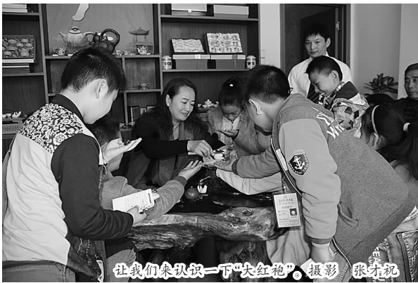
让我们来认识一下“大红袍”。