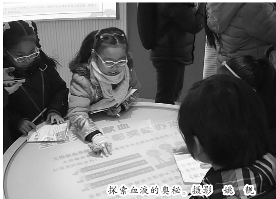
探索血液的奥秘。

不知不觉中,下课铃响了,这堂气氛活跃的公开课结束了,然而很多家长都坐着没有动,仿佛还沉浸在刚才上课的氛围中,在后来的填写评价表中,所有的家长都不约而同地留下了赞美和感谢老师的话语。