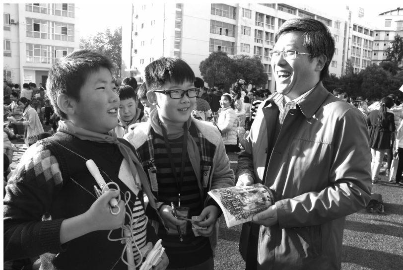
跳蚤市场里,同学们的“生意”做到了校长身上。

连云港市东海县双店小学 徐浩然 (小记者证编号 J154676) 指导老师 吉时勇