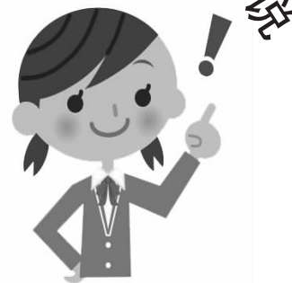
淮安涟水外国语小学 六(8)班 鲍嫣然 指导老师 段 玲

我想平平淡淡地对您说,我真的很想您。您如这朴实的文字,悄然无声地,就走进了我的人生,写下浓而不艳的篇章。一年很短吗?不,它有365个的日日夜夜。一年很长吗?不,也只有365个朝朝暮暮。只可惜我当年没有珍惜,失去了才追悔莫及。您是教了我六年的语文老师。是的,虽然您戴着古板的眼镜,看起来不苟言笑的样子,但这不能推翻这个事实——您爱笑。幽默是您最大的特点,同学们银铃般的笑声已成为您课堂的代名词。兴许是您敲过我一次头的缘故,那种痛感烙在了我的记忆里,甚是怀念。在紧张的学习中,一次次想起,又一次次笑起来,再也放不下。我骨子里的保守,不允许我轻易在别人面前落泪,可再见您,我违背了这个诺言。我说,我还想让您做我的老师,继续教我。您说,要接纳孤独,因为所有人的狂欢是所有人的孤独,而一个人的孤独就是一个人的狂欢。我不懂,只是不停地哭。你答应我们,再为我们上一堂课,可是您太忙。是的,上了又如何?四年级的那个班聚不齐了,分班的洪流冲散了昔日的同学,但不散的,是我们的心,我们都在思念您!对您的思念一写就停不下笔,但是天下没有不散的筵席,那么,就此收笔吧。愿在某一天,您迎着朝阳,走入教室。“上课!”“起立!”“同学们好!”您笑着说。我们一定会整齐而响亮地应答:“老师好!” 选自淮安涟水外国语小学《萌芽》 2016年3月31日第61期四版“诉说心语”