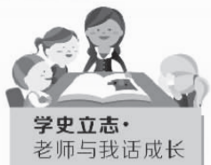
学史立志· 老师与我话成长