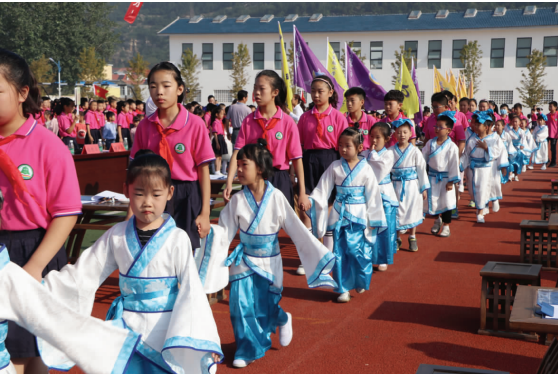
一年级新生入学礼