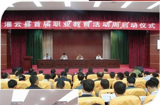
启动职业教育活动周