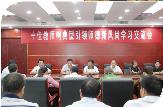
十佳教师学习交流会