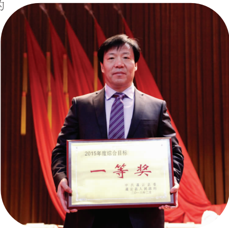
荣获全县综合目标考核一等奖

教育发展环境持续向好。强化校园安全。抓实主题教育，发放安全教育宣传资料近10万份，在全县上下营造人人关注学生安全、个个关心学生安全的良好社会氛围；扎实排查措施，近年来，