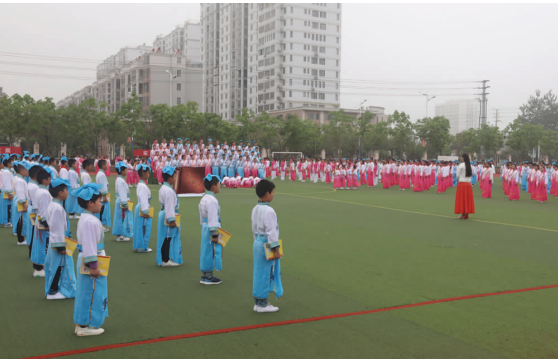
千人诵读成果展示