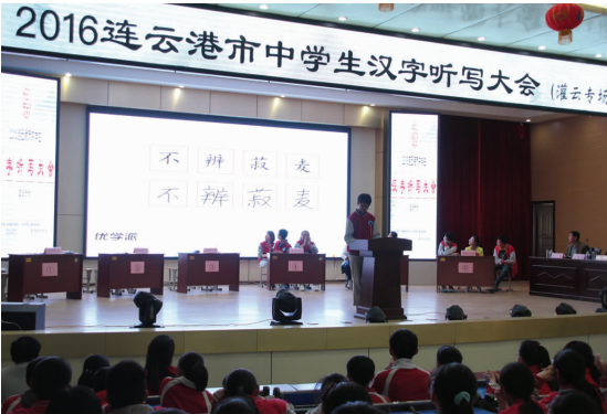
市汉字听写大赛灌云专场比赛