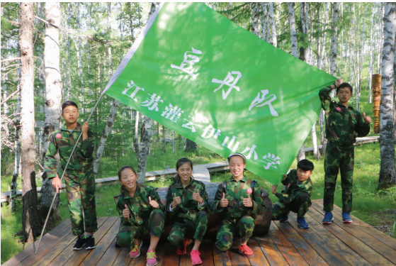
伊山小学代表队出征全国超级少年争霸赛