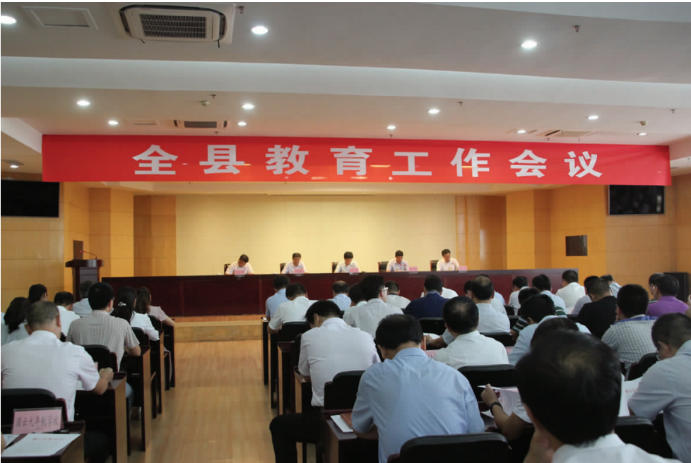
全县教育工作会议召开

教育是民族振兴、社会进步的重要基石。驻足时代的门槛，回眸近年来的发展历程，全县教育改革在县委、县政府的坚强领导下，统筹谋划，聚力攻坚，一些制约教育科学发展的体制性、制度性障碍开始“破冰”；一些人民群众关切的重大热点难点问题开始“破解”；一些重要领域的创新举措开始“破土”，县教育局获评2015、2016年度“县级机关绩效管理十佳单位”，并连续三年获得“全县经济和社会发展目标考核一等奖”及数十个单项奖。