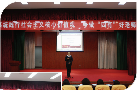
开展师德师风演讲比赛