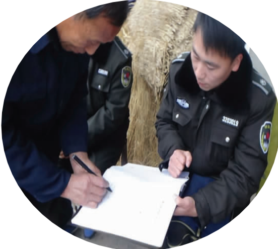
签订“门前三包”责任书