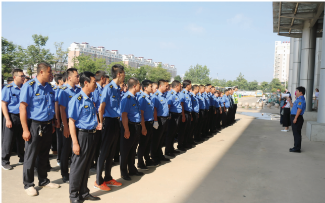
集中行动战前动员