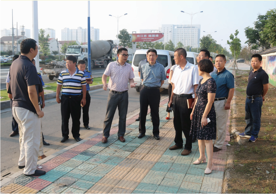
局领导检查城区环境

近年来，在县委、县政府的坚强领导下，县城管局紧紧围绕“四城同创”目标强力攻坚，按照“城市让群众生活更美好”的要求，扎实推进城市环境综合整治提档升级，全面提升城市管理水平，成功创建城市管理示范路和示范社区，2014—2016年被省文明委授予“江苏省文明单位”。