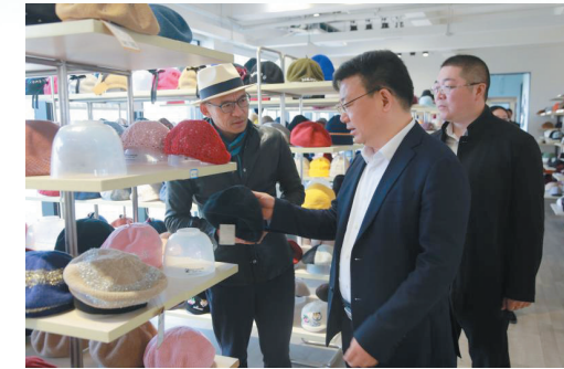
区委书记黄卫锋调研企业。

专题监督求实效。贯彻落实《南通市委员会关于加强和改进民主监督的实施办法》,区政协出台《关于对区政府为民办实事项目派驻民主监督小组的实施意见》,向区住建局、区市场监督管理局派驻民主监督小组,就为民办实事中的安置房建设项目和食品安全监督项目开展民主监督。通过座谈、考察、协商、不定期走访,监督小组成员提出23条合理化建议,并得到区政府相关职能部门采纳,畅通了安置房建设中老百姓的相关诉求,推进了区内各菜市场监测点规范化建设,取得了专题监督的实效。