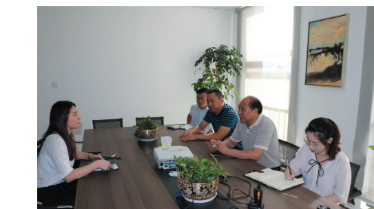
政协领导走访长江智谷。