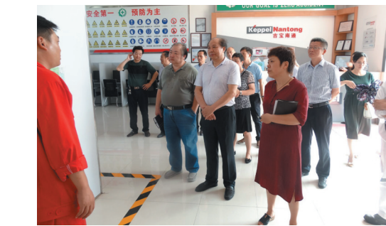
政协领导视察企业安全生产。