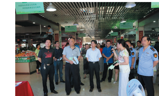
政协委员对食品安全进行民主监督。