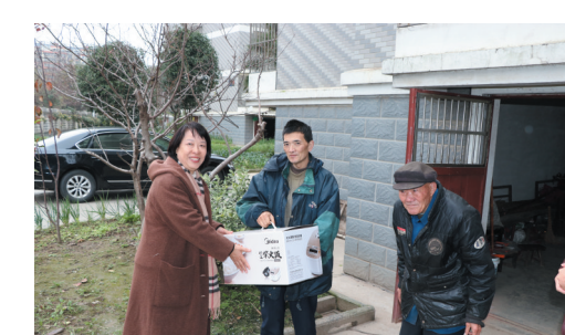
政协委员帮助困难群众实现微心愿。