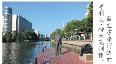
矗立在濠河边的亨利克·特来克铜像。