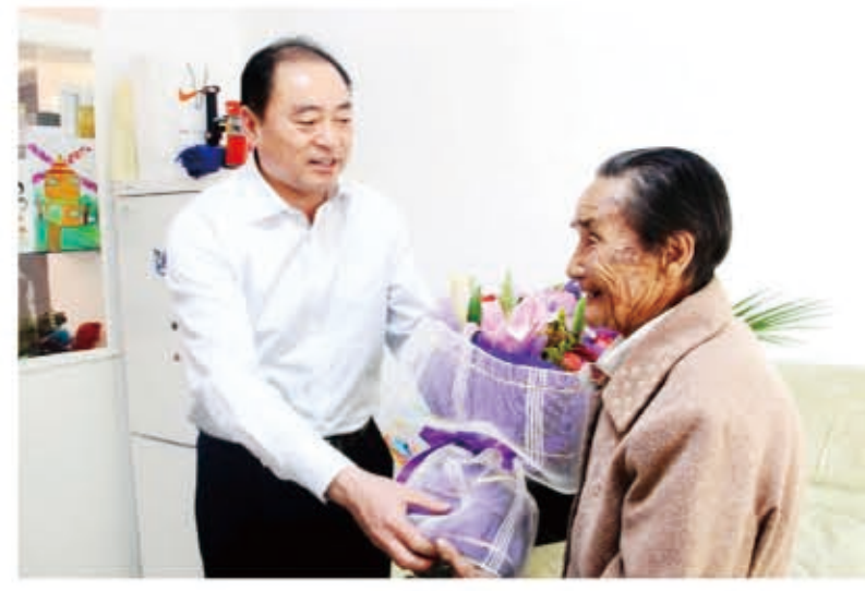
区委副书记、代区长施恩佩慰问老人

随着人口老龄化的步伐不断加快，区委、区政府十分重视社会养老问题。大力开展“尊老献爱心”活动，也是区慈善总会的一项重要工作。2008年以来，区慈善总会共投入慰问金200余万元，每逢重大节日都要对敬老院的五保老人进行走访慰问。积极配合上级慈善机构开展“慈善复明”行动，为部分白内障的老人免费进行检查和手术治疗，使多名老人重见光明。