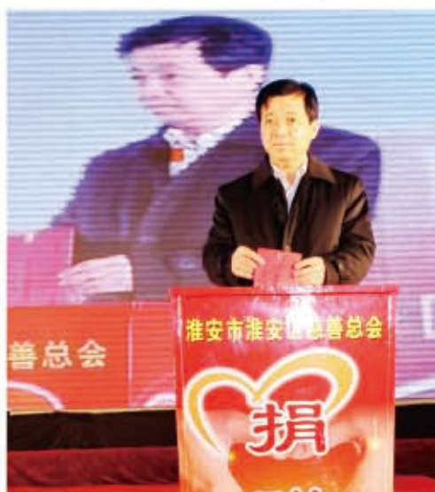
区委书记徐子佳带头捐款