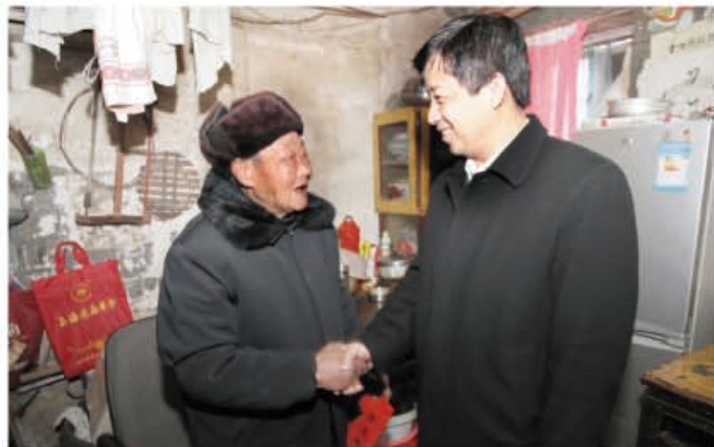
区委书记徐子佳慰问贫困户

无论经济社会发展到什么程度，都会有困难群体的存在。目前，淮安还有城乡低保对象2万余户、近6万人；处于低保边缘户4万多人，五保供养户5千多人。区委、区政府在实行兜底保障的同时，把慈善作为必要补充。多年来，区慈善总会为缓解城乡低保对象、下岗失业特困职工的生活困难，每年固定资助特困低保户、特困下岗职工不低于100户。2008年以来，有4万多名困难对象享受到救助，救助资金达6000万元，其中2015年共救助困难对象4000余人，发放救助善款近700万元。