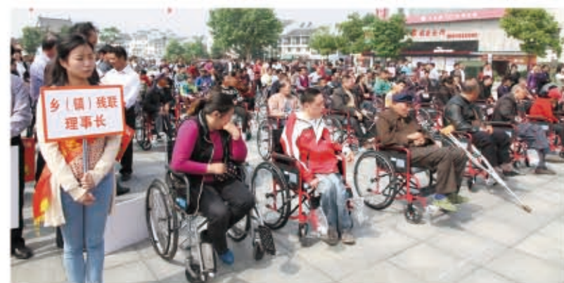
向残疾人免费集中发放轮椅

关心残疾人，是社会文明进步的重要标志。党和政府的关爱，是残疾人事业得以发展的重要保障。而慈善总会的关爱，则让他们感受到了社会大家庭的温暖。8年来，区慈善总会共救助残障患者1000人次。先后为生活困难的肢残人员赠送轮椅130辆，对生活困难的聋哑儿童资助“助听器”210只，配合相关部门实施了“微笑列车”、“心蕊工程”等活动，对全区100名贫困唇腭裂患者实施了免费修复手术。资助60名先天性心脏病儿童实施了手术。