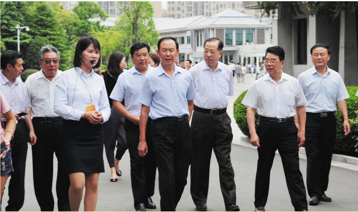
2016年8月26日上午,中华慈善总会常务副会长王树峰(中)一行来淮调研,对我区慈善工作取得的成果给予充分肯定。