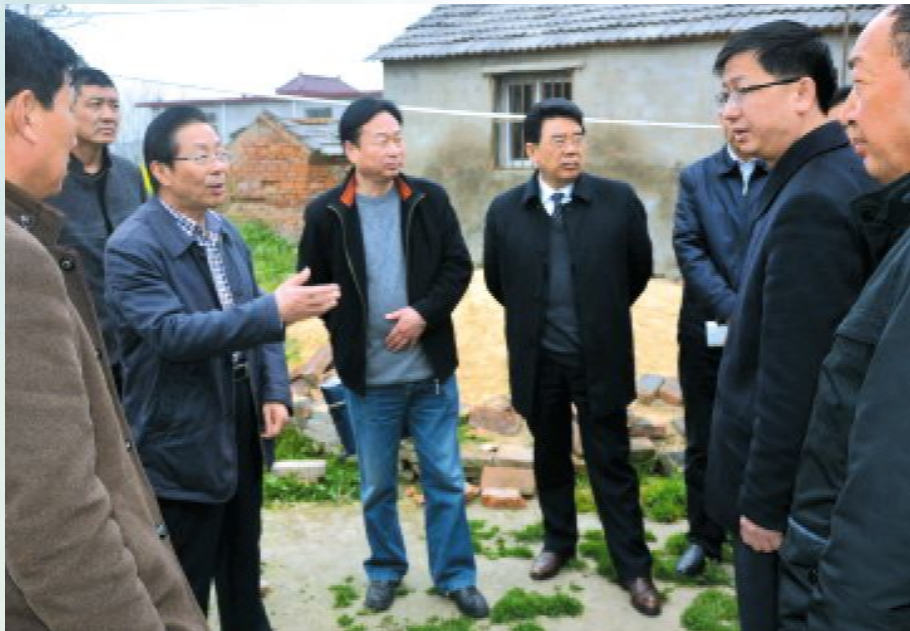
“慈善淮安·精准济困”率先在我区试点