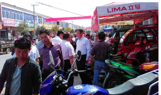
连日来,平桥镇组织城管、派出所、机关干部加强集镇秩序管理。重点整治内店外开、占道经营、流动摊点和车辆乱停乱放现象。

为加强电动三轮车、四轮车整治管理,从现在起对淮安电动三轮车、四轮车管理实行“四必扣、四必拘”规定。“四必扣”是指闯红灯必扣车,重点地段违法停车必扣车,闯红灯必扣车,逆向停车必扣车;“四必拘”是指驾驶人拒绝、阻碍管理,不听劝阻的必拘留,被查获三次以上(含三次)的必拘留,发生交通事故负有责任的必拘留,酒后驾驶的必拘留。拘留是指按《治安处罚法》和《道路交通安全法》的规定,进行行政拘留,构成犯罪的依法追究刑事责任。重点地段违法停车是指在禁止停车区域停车、在灯控路口附近50米范围内违法停车及在路面网状线范围内违法停车等。交通管理的相关规定由区公安分局负责解释。