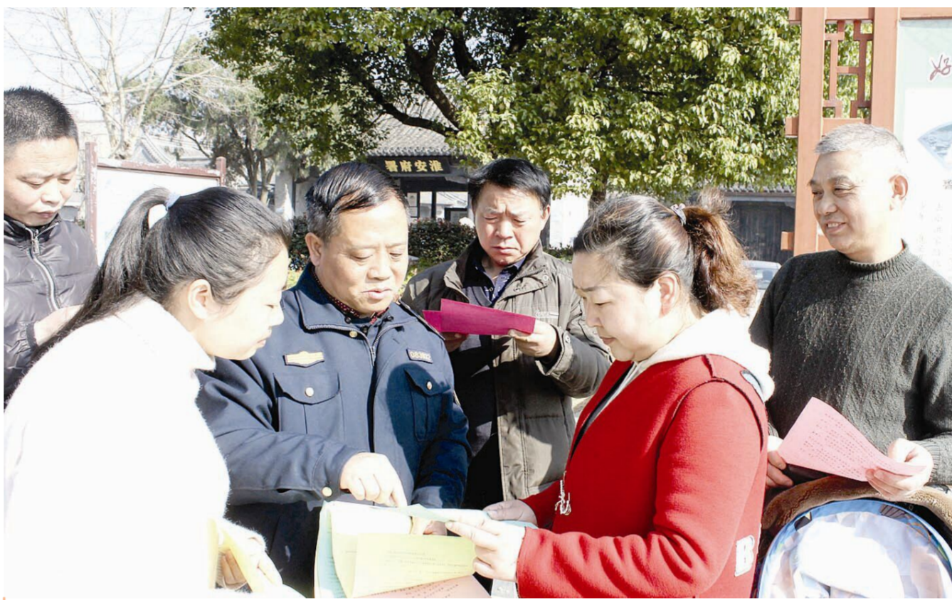
日前,区交通运输部门启动以“依法维权·畅享交通”为主题的“3·15”宣传周活动,组织人员深入社区、街道、车站、广场等场所,通过图解、卡片、展板等形式向市民宣传平安出行和维权救助途径。