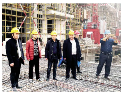
人防工程现场质量监督