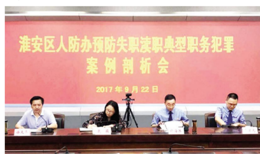
开展“检察长课堂”案件剖析