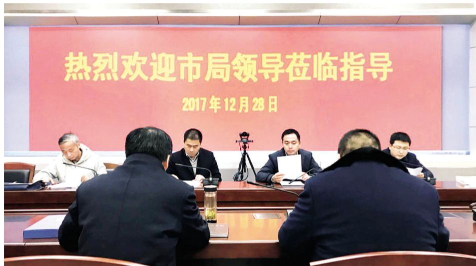
区委常委、常务副区长颜复陪同市民防务局考评组对淮安区年度考核

全体干部职工严格自律,规范行为。三是正气引领增强凝聚力。开展了庆“三八”话发展座谈会、迎新春工会活动等,走访慰问了困难职工、退休老同志,团结带领全办干部职工,心往一处想、劲往一处使、拧成一股绳,推动各项工作稳中求进、健康发展。