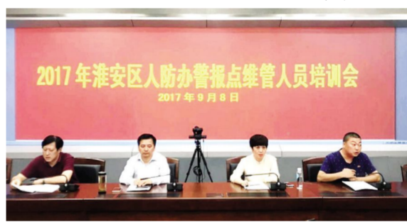
组织警报点维管人员培训